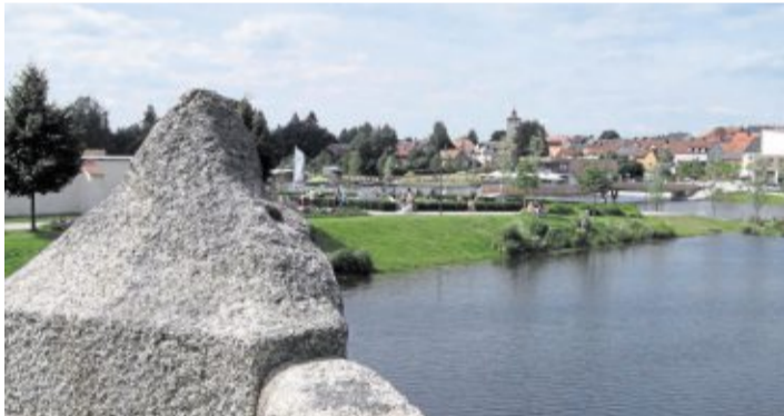
Am 29. Mai 2013 öffneten sich die Tore zur bayerischen Gartenschau „Natur in Tirschenreuth 2013“ (Bild). Nur wenige Kilometer entfernt begrüßte die böhmische Grenzstadt Eger zur gleichen Zeit Gäste aus dem In- und Ausland.

Doch es ging nicht nur lustig zu. Im gleichen Jahr erging ein Schreiben des Stadtrichters Anton Steinacker nach Eger, in dem er um die Entsendung eines Scharfrichters bat. Dieser kam in den Jahren 1460 bis 1633 immer wieder mit seinem breiten Richterswert, um seines schaurigen Amtes zu walten. Während des