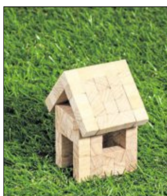
Wohnen im Holzhaus ist gut für die Klimabilanz.