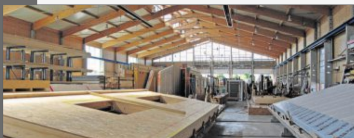
Blick in die Produktionshalle

Auf Bau-Info-Tagen können sich Interessierte umfassend über das Thema informieren