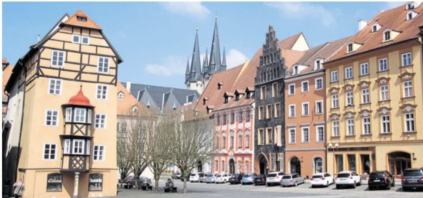
Allein das Stadtbild von Eger mit Kirchen aus dem 13. Jahrhundert und Resten der alten Kaiserburg erstaunte die Besucher aus den kleinen Ackerbürgerhäusern des Stiftlandes.