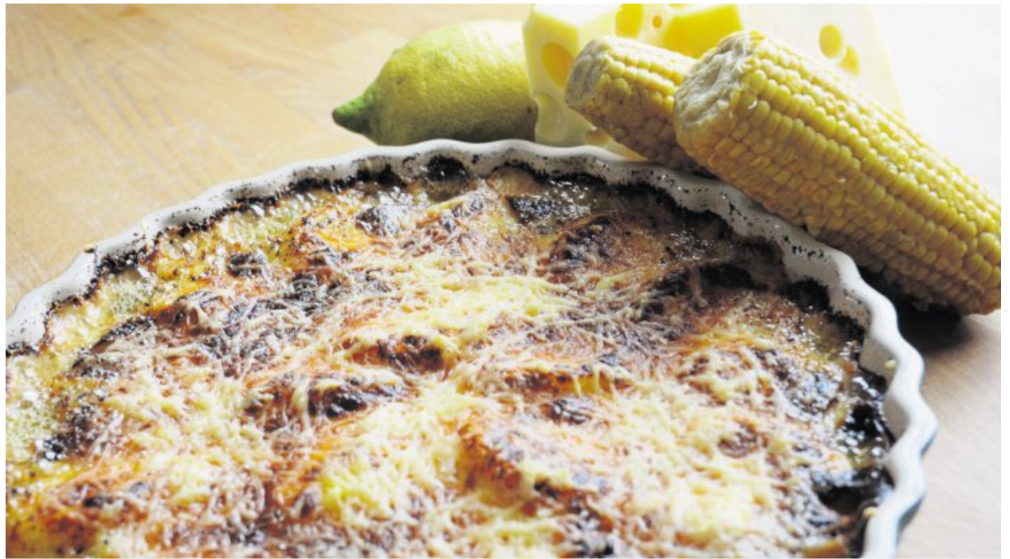
Aus Maismehl wird zuerst Polenta zubereitet. Sie kommt in die Auflaufform, wird mit Gorgonzola-Soße übergossen und mit Emmentaler überbacken.

Aus der erkalteten Polenta mit einer Ausstechform oder einem umgedrehten Glas runde Scheiben ausstechen. Eine feuerfeste Form mit reichlich Butter austreichen und die Scheiben darin verteilen, so dass sie einander leicht überlappen. Mit der Gorgonzola-Soße übergießen, mit