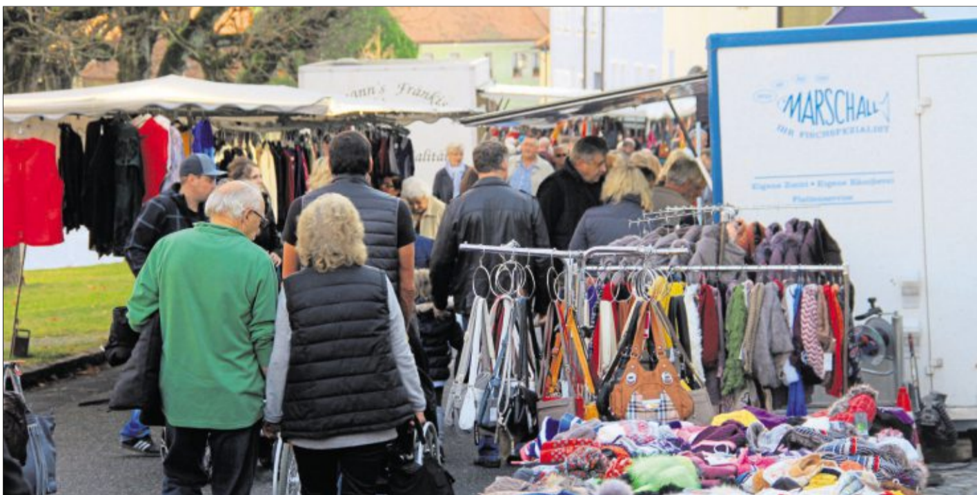
Am Martini-Markttag in Erbendorf findet jeder etwas passendes, denn auch die Geschäfte haben geöffnet.

Am Unteren Markt in Erbendorf bauen am 3. November die Fieranten ihre Stände auf