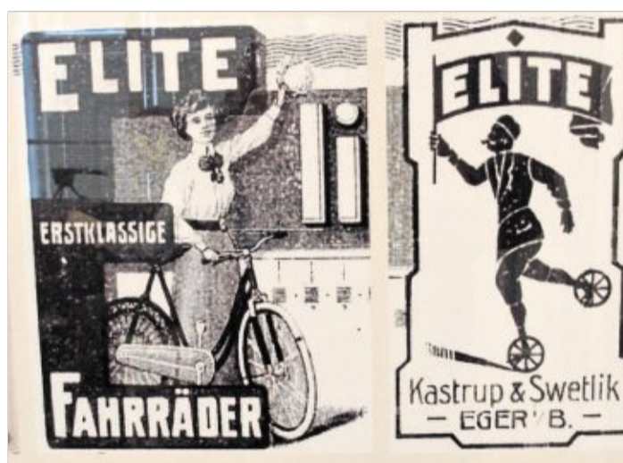
Viele Fabriken siedelten sich in Eger an.