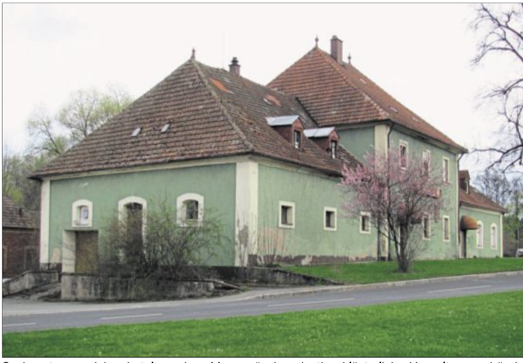
So kannte man jahrzehntelang das „Memory“: das einstige klösterliche Verwaltungsgebäude und spätere Wirtshaus wurde zu einer Jugendbetreuungsstätte umgebaut.

Dieses fand 2016 sein Ende, als die fortschreitende Bau-fälligkeit eine weitere derartige Nutzung nicht mehr er-