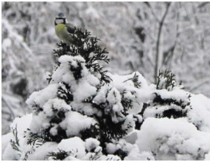
Die Thuja-Hecke gewährt der Meise nur eine gute Aussicht, aber keinerlei Früchte. Wer Vögeln einen Gefallen tun will, setzt auf Nährgehölze wie die Kornelkirsche.

■ Vogelfutter in Plätzchenform: Vogelfutter als Stern, Mond oder Tannenbaum – theoretisch ist diese Variante etwas zum Verschenken, weil dekorativ ist. In der Praxis brechen Vogelfutterplätzchen leicht und sind damit nicht mehr brauchbar. Außerdem erkennt man die jeweilige Form nach nur einem Meisen-Besuch ohnehin nicht mehr. Wer sich dennoch daran probieren will, braucht: Vogelfutter-Masse nach Grundrezept, Plätzchenformen (möglichst groß, möglichst ohne Spitzen und sonstig Filigranes), Alufolie, Strohhalme und Kordel.