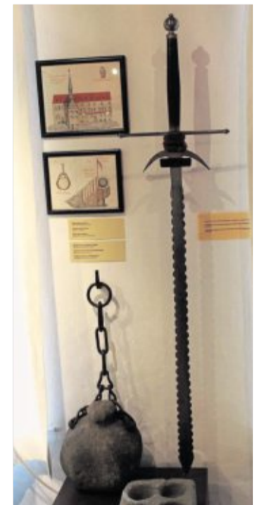
Das Scharfrichterswert aus Eger kam zeitweise auch in Tirschenreuth zum Einsatz.

Den ersten Teil des Artikels, über die Beziehungen zwischen Tirschenreuth und Eger, „Vielfältige Begegnungen“, gibt es nachzulesen auf www.onetz.de/owz