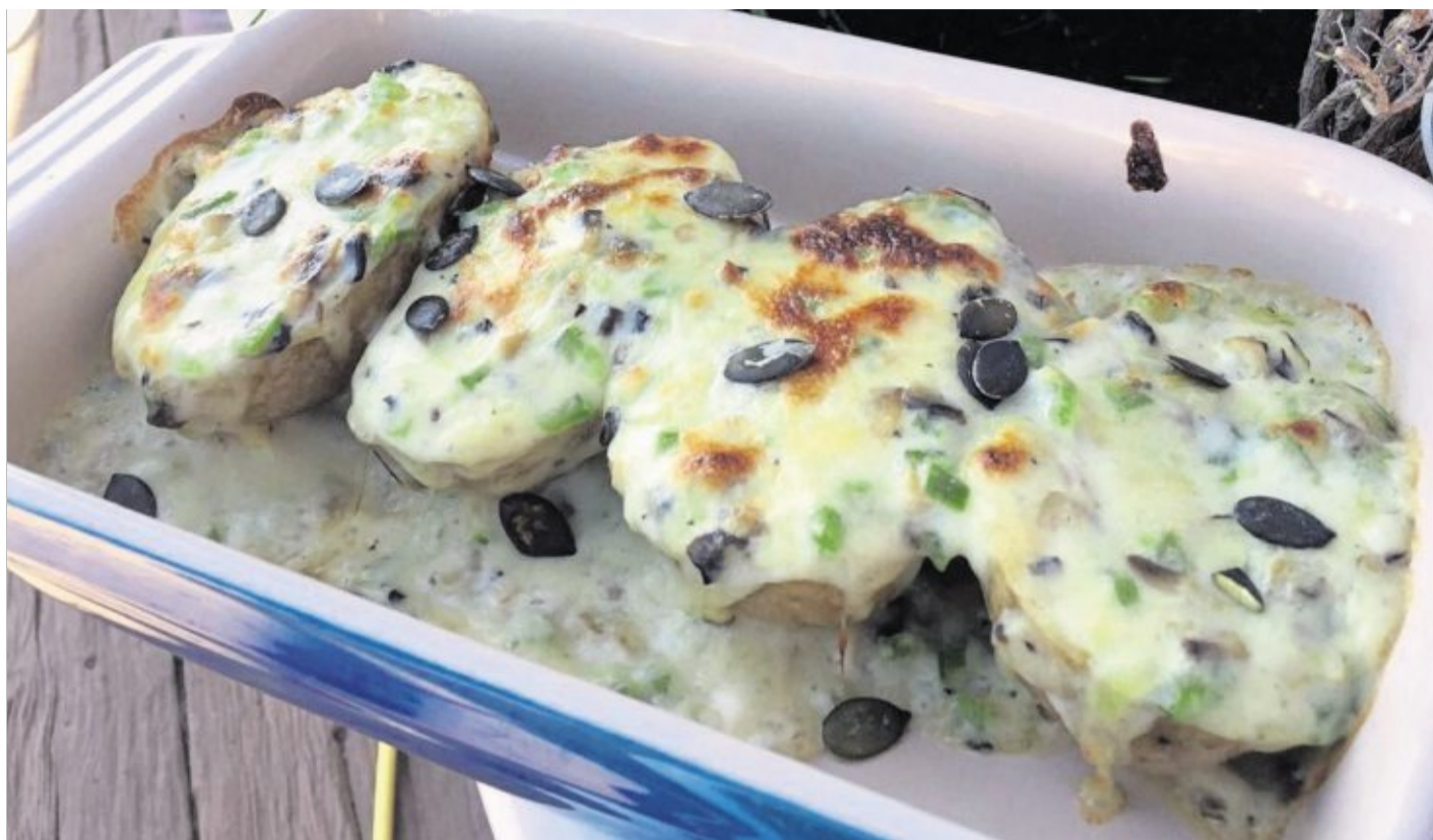
Die vorgekochten Kartoffeln werden in einer Auflaufform mit einer Champignon-Sauce und Käse überbacken.

Die Paprikaschote waschen. Die Kerne und die weißen Innenhäute entfernen. Die Paprika in kleine Würfel schneiden. In einem Topf Butter heiß werden las-