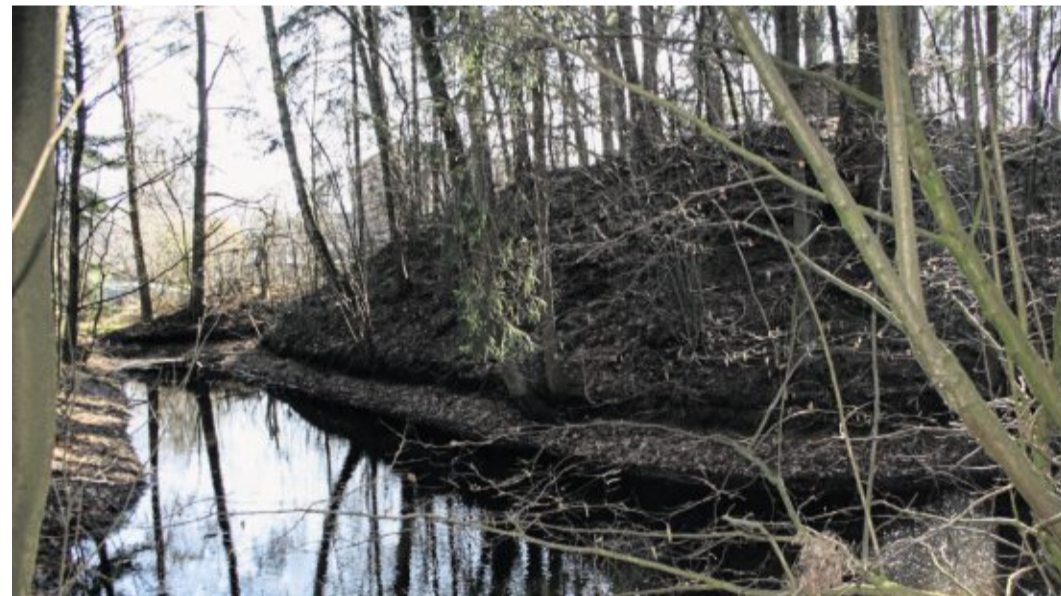
Seit rund 900 Jahren steht dieser Turmhügel nahezu unverändert neben dem Rastenhof und an der Goldenen Straße.

Der erste Teil der Wanderung auf www.onetz.de/3045070