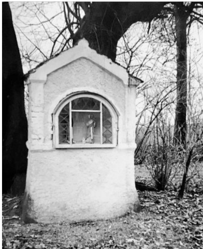
Der Bildstock steht am Rastenhof. Im Winter, wenn der Weg zur Kirche verwehrt war, konnten die Bewohner des Bauernhofes hier Andacht halten.

Und am Rastenhof? In klaren Mondnächten kann man manchmal vom Hügel aus ein Jammern hören. ‚Es ist der böhmische Ritter,‘ flüsterten in früheren Jahren die alten Bewohner, ‚er will bestimmt nach Hause.‘ Das Grab selbst aber blieb bis zum heutigen Tage unentdeckt.“