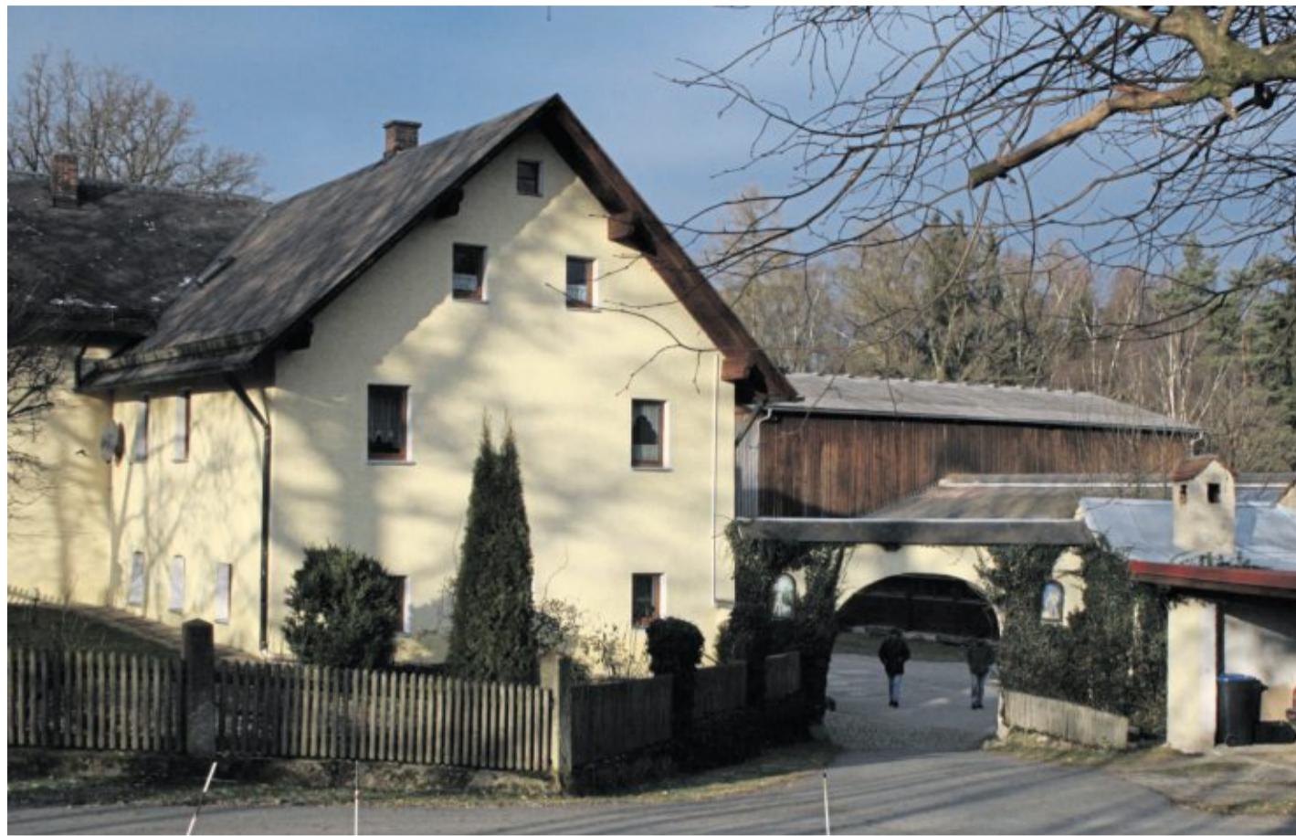
Über 110 Jahre ist der Rastenhof mit der Familie Scheidler verbunden.