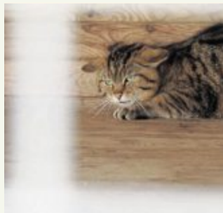
„Kuder“ kurz vor seiner Freilassung.

Einmal die Woche, immer am Freitag, werfen wir in unserem E-Mail-Newsletter „7 Tage 7 Texte“ einen Blick zurück. Welche sieben Artikel aus dem Onetz haben uns an den vergangenen sieben Tagen am meisten interessiert oder berührt? Gibt es außergewöhnliche Lesestücke oder Geschichten, die wir Ihnen nicht vorhalten wollen?