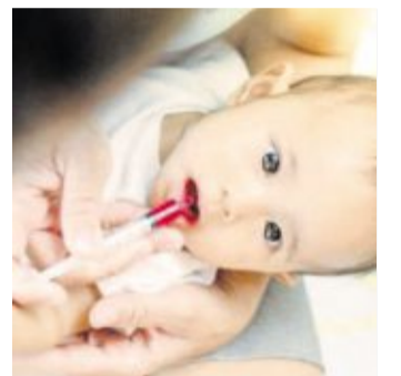
Mit einer Spritze ohne Nadel lassen sich flüssige Arzneimittel für Babys am besten dosieren.

Kleinkinder brauchen Arzneimittel in genau festgelegten Dosierungen. Werden die