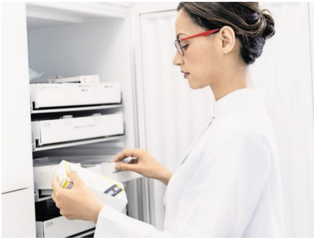
Viele Arzneimittel müssen kühl gelagert werden. Deshalb gibt es in jeder Apotheke Kühlschränke. Aber auch zu Hause sollte man darauf achten, dass Medikamente kühl bleiben.

Die meisten Arzneimittel sollten zwischen 15 und 25 Grad gelagert werden. Aber einige Arzneimittel gehören in den Kühlschrank, zum Beispiel Insuline. Wenn es auf der Verpackung vermerkt ist, sollten sie zwischen 2 und 8 Grad aufbewahrt werden. Benkert: „Es gibt außerdem kühlkettenpflichtige Arzneimittel, die auch während des Transports von der Apotheke zum Patienten eine kontinuierliche Kühlung brauchen. Diese eignen sich nicht für einen Versand per Post.“