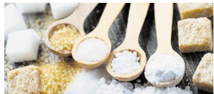
Zucker-Alternativen sollte man sparsam einsetzen. Bei Sucralose sollte man besonders aufpassen.

bereits ab einer Temperatur von 120 Grad. Der Süßstoff sollte daher nur für kalte Speisen oder Getränke verwendet werden. Bei warmen Speisen ist es besser, Sucralose erst nach dem Erhitzen zuzugeben. (exb)