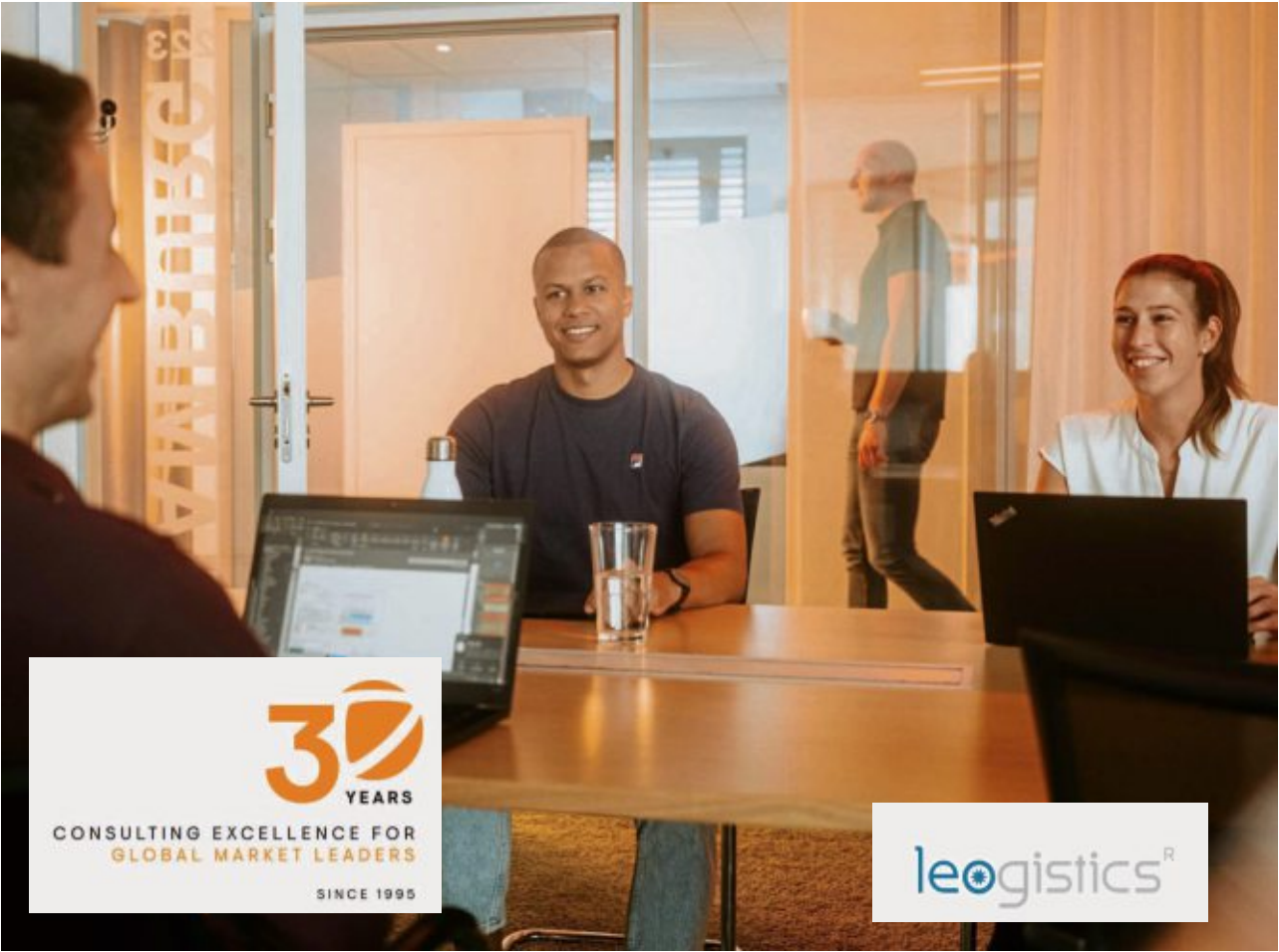
Wir bieten attraktive Karrierechancen in der Oberpfalz!

Für den Aufbau des Teams suchen cbs und Leogistics mehrere neue Kol-