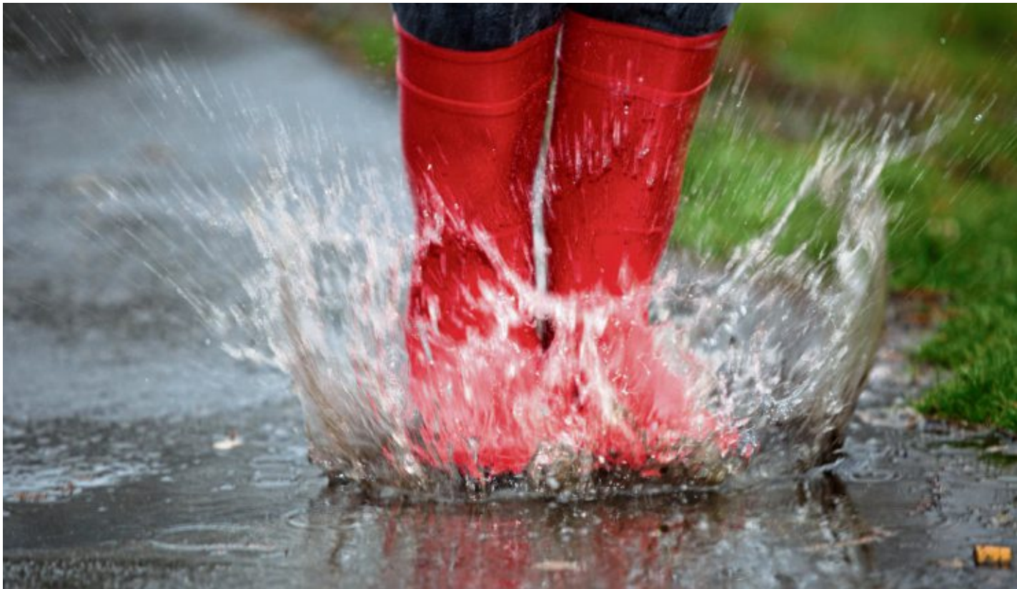
Nicht nur Kindern macht es Spaß, in Pfützen zu springen.