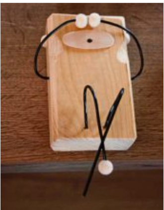
Nur noch die letzte Holzkugel festkleben und schon ist der „Nichts sehen“-Affe fertig.

derne Wohnräume – natürlich, rustikal oder skandinavisch. Sie eignet sich auch als Geschenk mit Symbolkraft