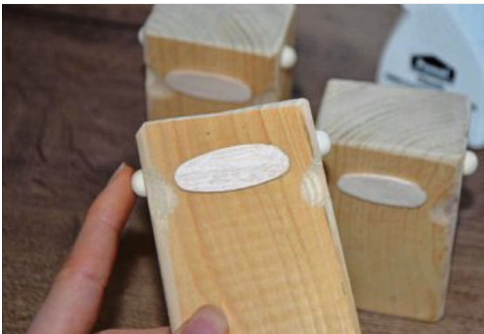
Halbierte Holzkugeln lassen sich gut als Affenohren nutzen. Sie werden mit Holzleim fixiert.