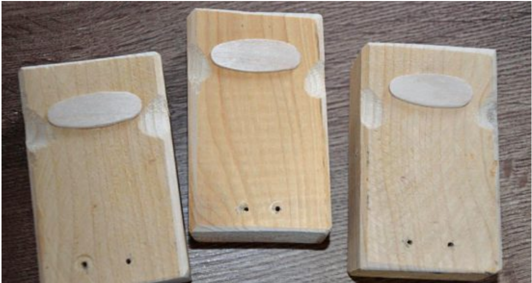
Frisch gebohrt und mit Mund versehen, lassen sich die drei Affen mit viel Fantasie schon errahnen.

An dem Endstück der Drähte befestigen wir mit Heißkleber je eine Holzkugel. Für die Affenohren kleben wir seitlich oben am Holzkörper links und rechts je eine halbierte Holzkugel fest. Als nächstes kleben wir die Arme und Beine in die vorgebohrten Löcher und fixieren die Holzkugeln an den Augen und Ohren beziehungsweise am Mund des jeweiligen Affen. Mit einem dünnen Filzstift malen wir einfache Gesichter auf das Kantholz. Ich habe mich für minimalistische Augen und Münder entschieden. Diese DIY-Version der drei Affen passt perfekt in mo-