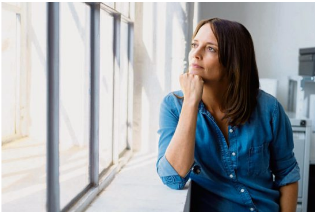
Grübeln ist eine gedankliche Endlosschleife ohne Ergebnis.

„Ich denke, also bin ich“, sagte der französische Philosoph René Descartes. Tatsächlich verbringen wir Menschen viele Stunden und Tage unseres Lebens damit, über die unterschiedlichsten Dinge nachzudenken. Und wir sind meist der Überzeugung, dass es doch nun wirklich nicht verkehrt sein kann, sich gründlich Gedanken zu machen. „Denk nochmal in Ruhe darüber nach“, sagen wir zu unseren Freunden also nur zu gerne, wenn diese vor einer wichtigen Entscheidung stehen. Dabei vergessen wir jedoch, dass uns zu viel Grübeln oft gar nicht gut tut – und dass wir auch beim Denken viele Fehler machen können. Im schlimmsten Fall kann das sogar zu einer Verzerrung der Wirklichkeit führen. Stellen Sie sich vor, ein Kollege schaut Sie böse an