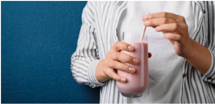
Häufig enthalten Trinkmahlzeiten Zuckerarten wie Maltodextrin oder Süßstoffe sowie zahlreiche Zusatzstoffe.

„Auch wenn Trinkmahlzeiten gelegentlich eine praktische Option sein können, fehlen ihnen wichtige sekundäre Pflanzenstoffe, wie sie in Vollkornprodukten, Gemüse und Obst reichlich enthalten sind.“ Für eine ausgewogene Nährstoffversorgung, eine gesunde Verdauung und ein langanhaltendes Sättigungsgefühl empfehle sich daher eine Ernährung mit frischen, abwechslungsreichen Lebensmitteln. (exb)