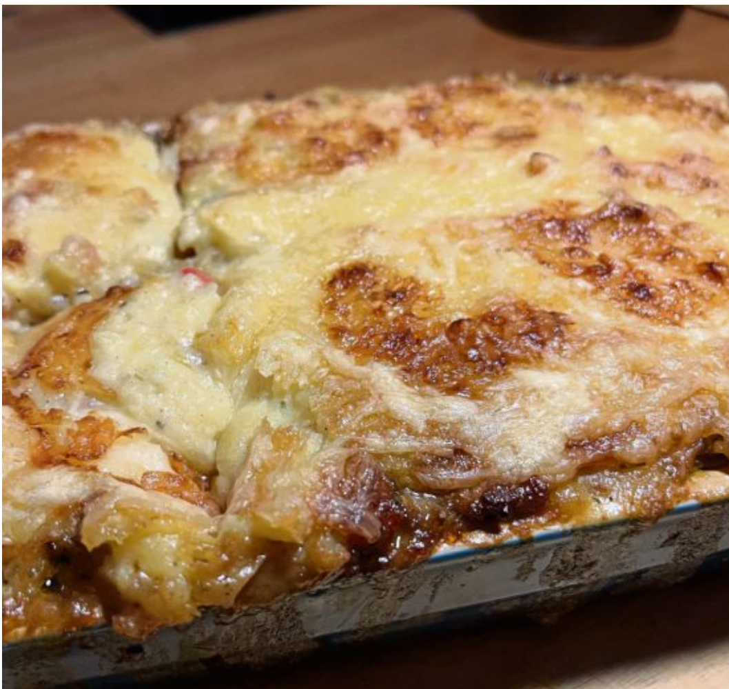
Der Fleischauflauf „Filosoof“ wird im Ofen mit geriebenem Gouda überbacken.

Zubereitung: Kartoffeln waschen und gut abbürsten. Die Kartoffeln in einem Viertel Liter Wasser zum Kochen bringen und von da an 30 Minuten garen. Mit kaltem Wasser abschrecken und die Schale abziehen. Die Kartoffeln mit einer Gabel zu Mus zerdrücken mit Sahne und zwei Esslöffeln Butter glattrühren. Mit Salz und Muskatnuss würzen. Zwiebeln schälen und wür-