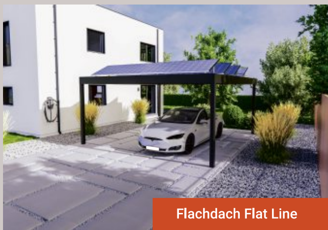
Flachdach Flat Line