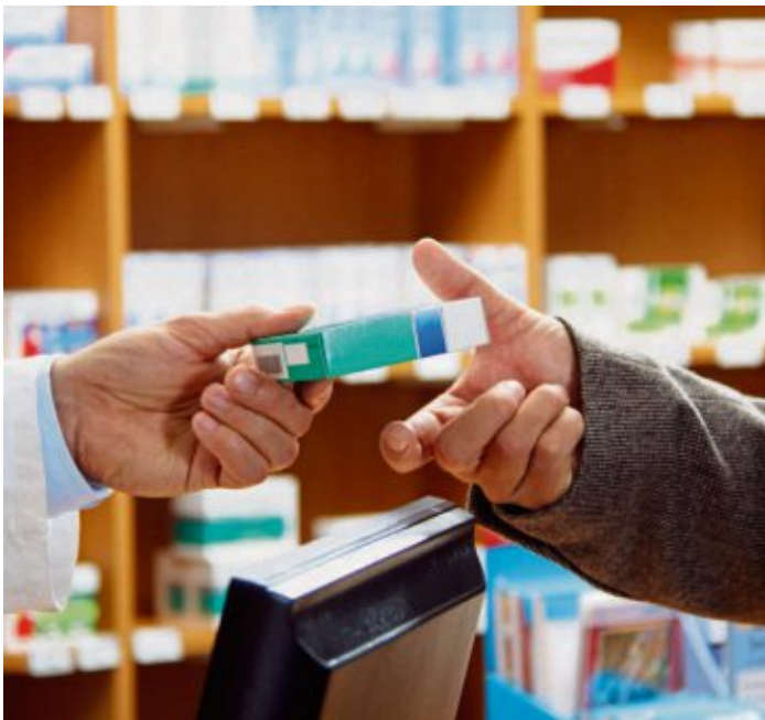
Die Ausgaben für Medikamente, Heilmittel und weitere Krankheitskosten müssen durch Belege nachgewiesen werden.

eine bestimmte Maßnahme oder ein Medikament empfiehlt, bitte die Quittungen sammeln“, rät Ernstberger. „Denn erst am Jahresende ist klar, wie hoch die Ausgaben für Arznei, Heilmittel und Behandlungen tatsächlich