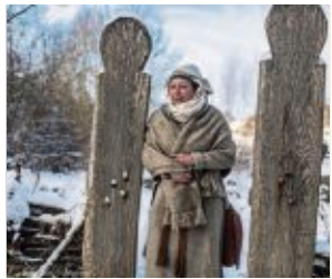
Am 30. November öffnet der Geschichtspark noch einmal seine Pforten und lädt zu Thementag Weihnachten ein.

Bärnau. Woher kommt das Christkind, seit wann haben wir einen Tannenbaum und hat Coca-Cola den Weihnachtsmann erfunden? Antworten auf diese und weitere Fragen bekommen die Besucher bei den Weihnachtsführungen am 30. November im Geschichtspark Bärnau. Das Team lädt ein, die Adventsstimmung des Geschichtsparks zu genießen. Deshalb öffnet der Park außerhalb der Saison seine Tore und gewährt Einblicke in mittelalterliches Leben während der frostigen Jahreszeit. Die offenen Weihnachtsführungen finden um 11 Uhr, 12.30 Uhr und 14 Uhr statt. Der Geschichtspark ist von 10 bis 16 Uhr geöffnet, letzter Einlass ist um 15 Uhr.