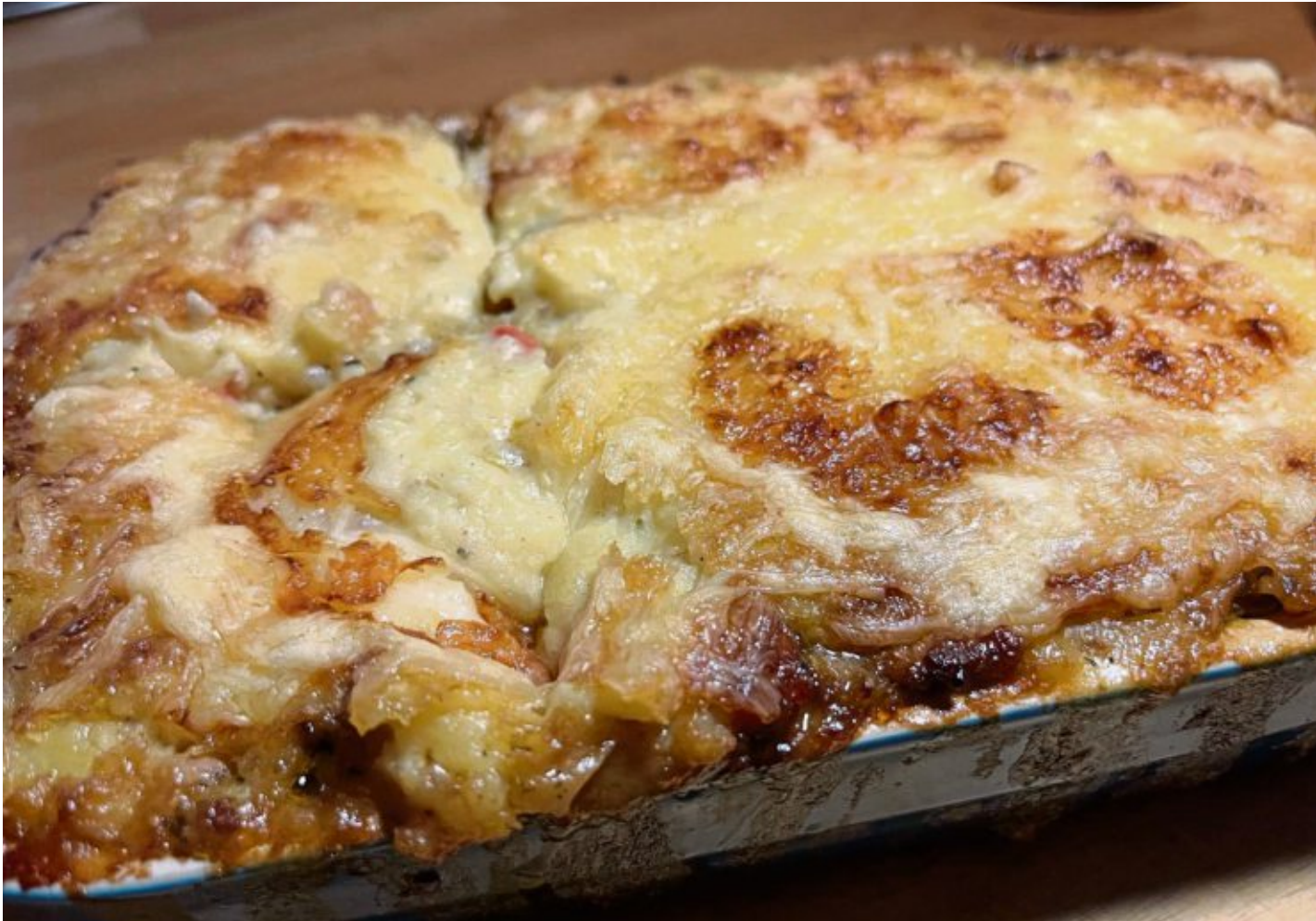
Der Fleischauflauf „Filosoof“ wird im Ofen mit geriebenem Gouda überbacken.