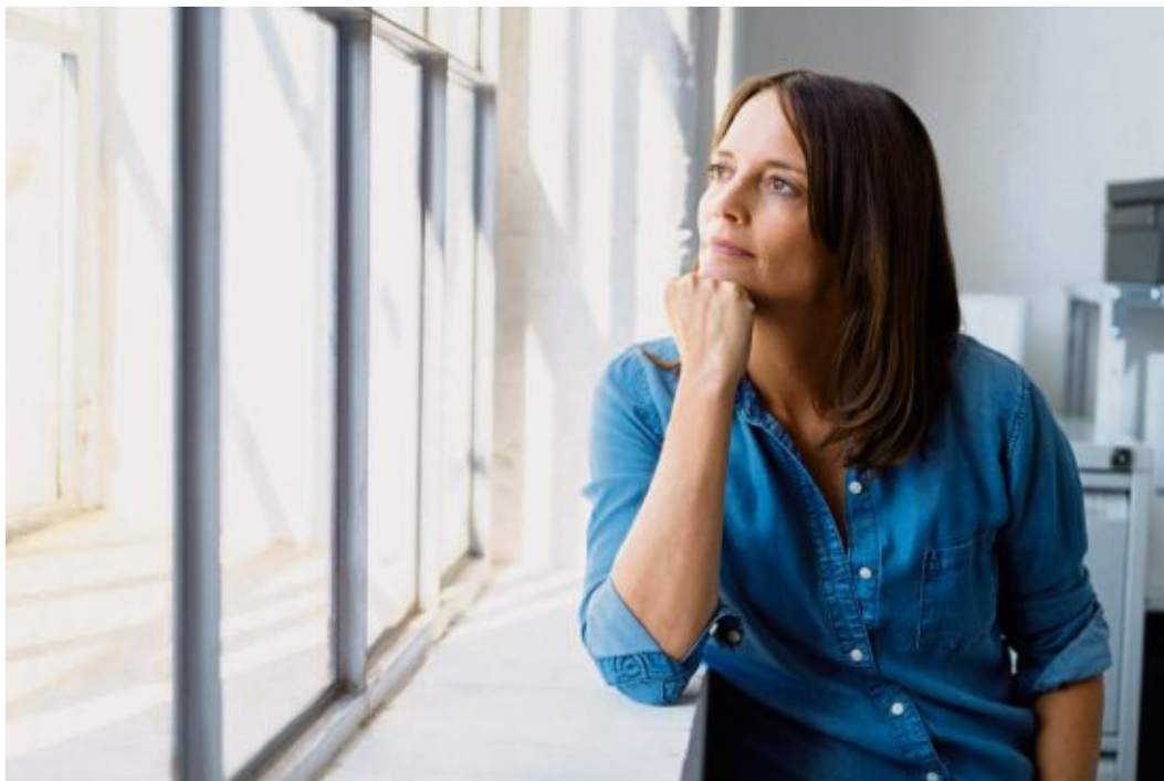
Grübeln ist eine gedankliche Endlosschleife ohne Ergebnis.

„Ich denke, also bin ich“, sagte der französische Philosoph René Descartes. Tatsächlich verbringen wir Menschen viele Stunden und Tage unseres Lebens damit, über die unterschiedlichsten Dinge nachzudenken. Und wir sind meist der Überzeugung, dass es doch nun wirklich nicht verkehrt sein kann, sich gründlich Gedanken zu machen. „Denk nochmal in Ruhe darüber nach“, sagen wir zu unseren Freunden also nur zu gerne, wenn diese vor einer wichtigen Entscheidung stehen. Dabei vergessen wir jedoch, dass uns zu viel Grübeln oft gar nicht gut tut – und dass wir auch beim Denken viele Fehler machen können. Im schlimmsten Fall kann das sogar zu einer Verzerrung der Wirklichkeit führen. Stellen Sie sich vor, ein Kollege schaut Sie böse an