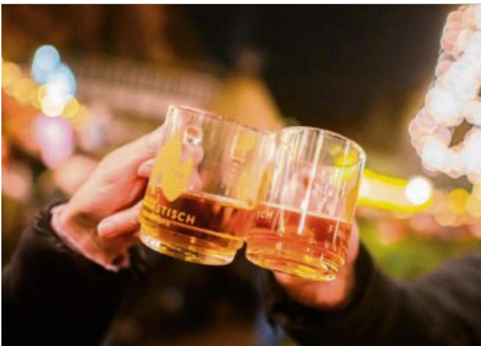
Glühwein gehört für viele zur Vorweihnachtszeit.