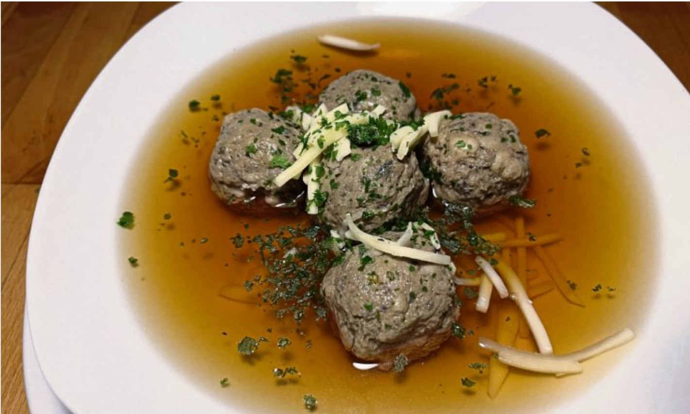
Die Klößchen werden in die köchelnde Bouillon gegeben, kurz gar ziehen lassen. Serviert wird mit Petersilie und Käsestreifen.