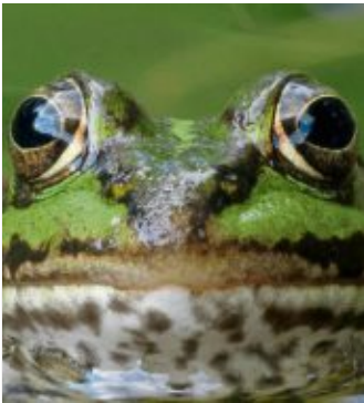
Ein Wasserfrosch lugt aus dem Teich.

Karten gibt es an den bekannten Vorverkaufsstellen und an der Abendkasse.