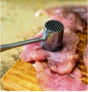
Schnitzel werden geklopft. Auch das macht das Fleisch zarter.

Wer keine industriellen Zartmacher verwenden möchte, kann Fleisch auch mechanisch bearbeiten. Beim Klopfen etwa werden die Fasern aufgebrochen. Neben den bekannten Fleischklopfern gibt es auch sogenannte Tenderizer oder Steaker mit kurzen Klingen oder speziellen Nadelprofilen. Auch Marinieren oder langes Schmoren macht Fleisch auf natürliche Weise zarter. (exb)