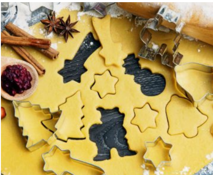
Weihnachtsplätzchen schmecken nicht nur lecker, sondern sind auch gut für die Stimmung.

„Oh, wie lieb ich die Gerüche aus der warmen Weihnachtsküche. Zieht der süße Duft hinaus, riecht man ihn im ganzen Haus. Hörnchen, Herzen, Zuckerkringel, Pfeffer-