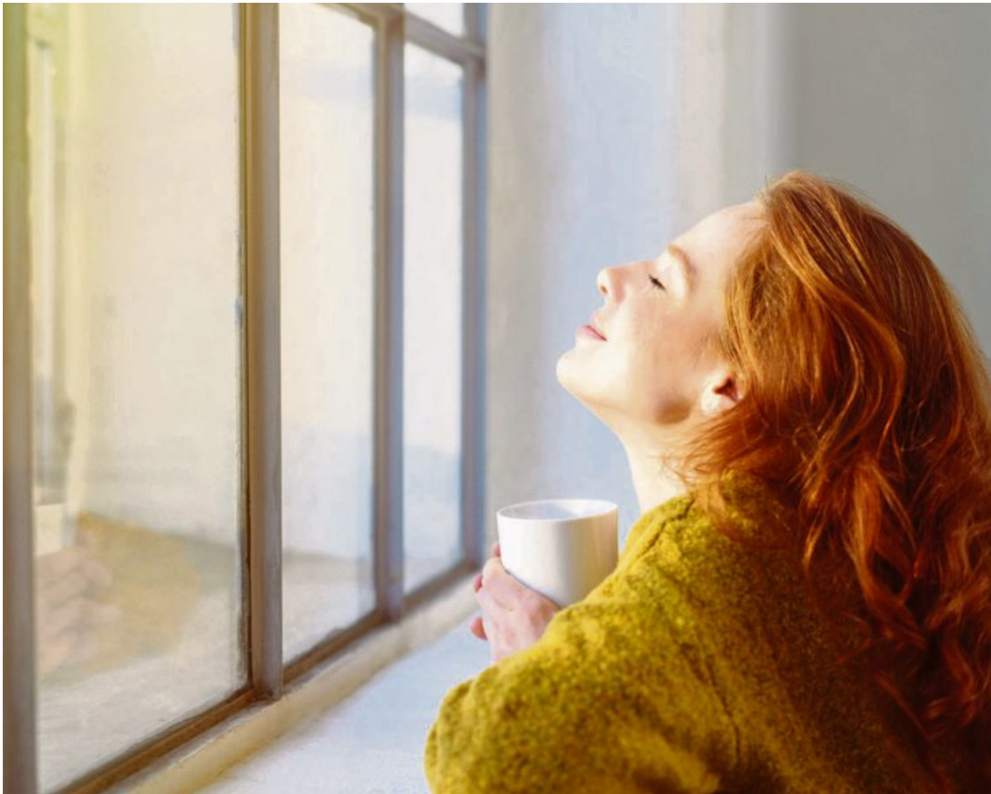
Manchmal sollten wir tatsächlich einfach abwarten und Tee trinken.