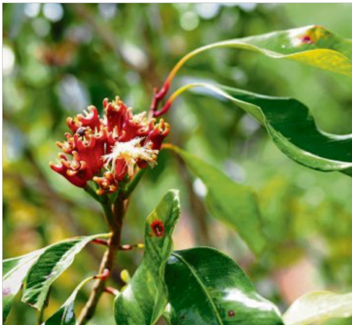
Im Mittelalter kam die Gewürznelke als kostbares Luxusgut nach Europa.

In Asien nutzt man die Gewürznelke seit der Antike als Heil- und Gewürzpflanze. Sie stammt von den indonesischen Molukken, auch bekannt als Gewürzinseln. Im Mittelalter kam sie als kostbares Luxusgut nach Europa. Gewürznelken enthalten ätherisches Öl wie Eugenol. Das ist für den intensiven Geruch verantwortlich. Laborversuche zeigen, dass Eugenol das Wachstum von Bakterien, Pilzen und Viren hemmen kann. Zudem besitzen sie einen hohen Gehalt an Phenolverbindungen, natürlichen Antioxidantien, schreibt das Gesundheitsmagazin „Apotheken Umschau“. Der Name „Nelke“ stammt vom mittelhochdeutschen „negelkin“, was „Nägelchen“ bedeutet. Tatsächlich färben