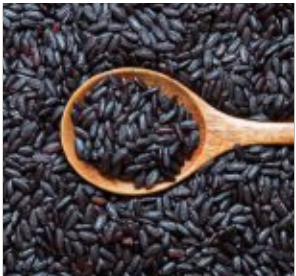
Venere-Reis ist eine Kreuzung.

Venere-Reis, auch als „schwarzer Reis“ bekannt, ist eine Kreuzung aus asiatischem schwarzem Vollkornreis und italienischem Rundkornreis. Schon im alten China galt schwarzer Reis als besondere Delikatesse. Als „verbotener Reis“ soll er nur dem Kaiser vorbehalten gewesen sein. In den 1990er-Jahren wurde er im Piemont zum heutigen Venere-Reis weitergezüchtet. Das Besondere an dieser Reisspezialität ist die tiefschwarze-violette Farbe, die auch beim Kochen nicht verloren geht. „Die auffällige Farbe verdankt die Venere-Reis den Anthocyanen in der Schale. Diese Pflanzenstoffe haben eine antioxidative und gefäßschützende Wirkung“, so Daniela Krehl, Ernährungsexpertin bei der Verbraucherzentrale Bayern. Anthocyane sind in größerer Menge beispielsweise auch in Beerenobst, Rotkohl und Rote Bete enthalten. Den Namen Venere, die italienische Bezeichnung für die Liebesgöttin Venus, trägt der Reis nicht zufällig. Seit jeher wird ihm eine aphrodisierende Wirkung nachgesagt, wissenschaftlich bewiesen sei dies jedoch nicht. Da Venere-Reis nicht geschält wird, enthält er die Nährstoffe des vollen Korns, darunter Zink, Selen und Ballaststoffe. Geschmacklich erinnert er an nussige, aromatische Vollkornsorten. Mit seiner intensiven Farbe ist er ein optischer Hingucker auf dem Teller und eine beliebte Beilage an Festtagen – besonders im Kontrast zu hellem Fisch, Meeresfrüchten oder buntem Gemüse. (exb)