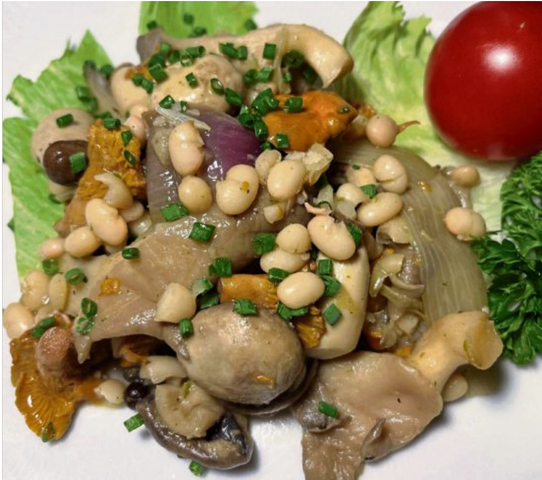
Vor dem Servieren wird das Bohnen-Pilz-Gemüse mit frischem Schnittlauch bestreut.

Pfifferlinge putzen. Eventuell etwas kleiner schneiden. Die Schalotten schälen, nur größere Exemplare zerteilen. Den Knoblauch schälen und in feine Stifte schneiden. Das Gänseschmalz in einem Topf zerlassen, die Schalotten und den Knoblauch