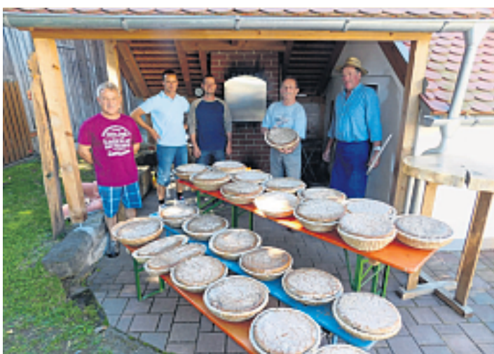
Ein eingespieltes Team sorgt für leckere Schmankerln aus dem Backofen.

die Musikautomatenausstellung „Musikum“ im benachbarten „Meisterhaus“, Trautenbergstraße 30, um „Musik aus einer anderen Welt“ zu hören und bei Kaffee und Kuchen über Geschichte und Gegenwart, Gott und die Welt zu plaudern.