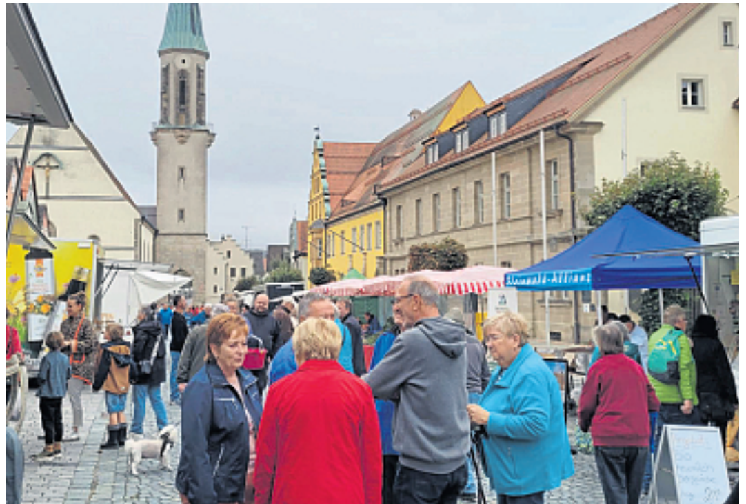
Einiges geboten ist beim Mai-Wochenmarkt in Kemnath.

Natürlich starten die Gärtnereien mit frischen Blumen, Kräutern, Salat- und Gemüsepflanzen in die Gartensaison. Zudem ist der Klosterladen der Abtei Waldsassen mit einem Stand vertreten, an dem es neben den Klosterladen-Produkten das neu erschienene Buch „Faszination Wildkräuter“ 300 Seiten voller Kräuterwissen, Rezepte und