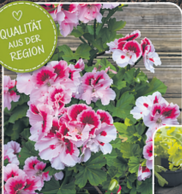
BEET- & BALKONPFLANZEN