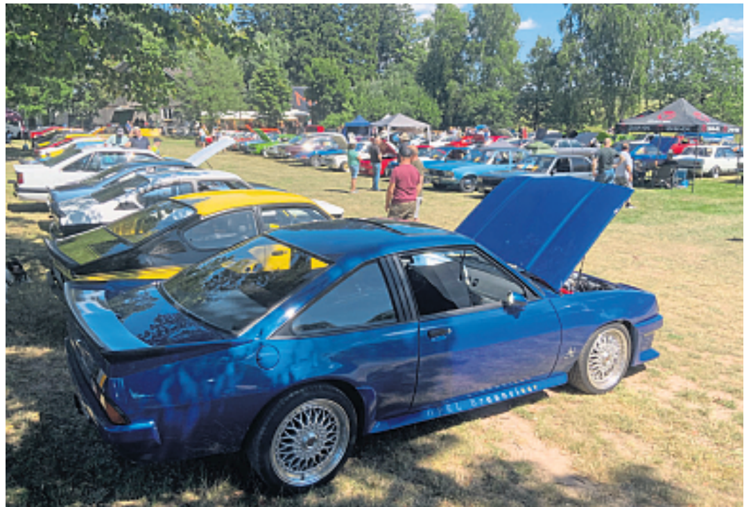
Opel, wohin das Auge blickt, am 19. und 20. Juni sind die Hecktriebler wieder in den Biberbachauen zu bestaunen.

Oberbibrach. (edo) Richtig verschwunden von der Bildfläche war der „Opelclub Oberbibrach 89“ und deren stets ins Auge stechende und in Ohr gehende „Hecktriebler“ aus den 1970ern und 1980ern nicht wirklich: Die Mantas, Asconas und Kadetts vom Oberbibracher Opelclub zieren heute noch die Straßen der Region. Nachdem 2024 und 2025 nach über zwei Jahrzehnten wieder erfolgreiche Treffen in der Biberbachau stattfanden, strömen auch heuer wieder die Rüsselsheimer Bolliden ins Bibertal.