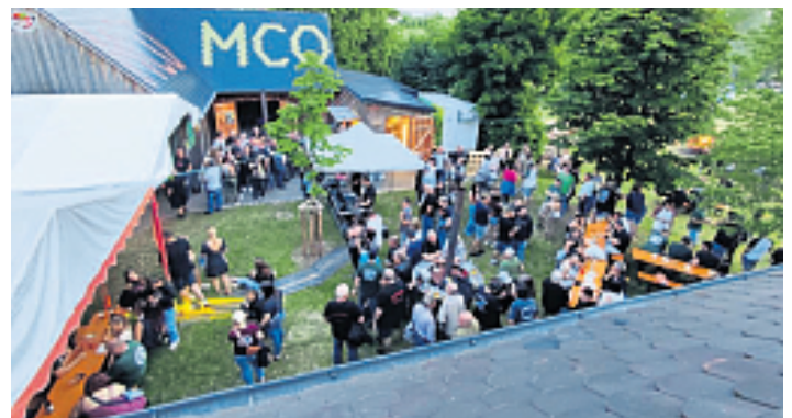
50 Jahre MC Oberbibrach wird gebührend gefeiert

Fürs leibliche Wohl ist unter anderem mit Grill-Spezialitäten und Currywurst, am Ausschank und in der Bar gesorgt. Für Biker stehen mehrere Wiesen zum Campen bereit, zudem gibt es Frühstück. Den Abschluss bildet ein Weißwurst-Frühschoppen am Sonntag. Ein besonderes Highlight wartet noch an der Pokal-Verleihung: Von „Speedy’s Metallschmiede“ werden aus Pokalen aus mehreren Jahrzehnten neue Trophäen gefertigt, die es in den entsprechenden Wertungen zu gewinnen gibt. Der Eintritt ist, wie für ein Motorradtreffen üblich, an allen Tagen frei.