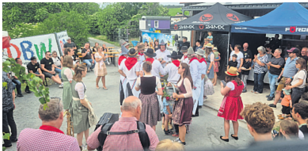
In Frankenberg wird vier Tage lang fröhlich Kirchweih gefeiert.

Am Freitag folgt der große Preisschafkopf im Festzelt – ein Highlight für alle Kartenfreunde mit vielen attraktiven Sachpreisen.