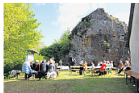
An Christi Himmelfahrt kommen die evangelischen Christen der Kulmregion beim kleinen Kulm zusammen.

Neustadt am Kulm. (rpp) Die Schmökerstube in Neustadt am Kulm ist eine kleine, aber feine Bücherei der evangelischen Kirchengemeinde. Immer wieder werden in oder um das Gemeindehaus kleine Events für die Kinder, die Jugendlichen oder die Erwachsenen angeboten.