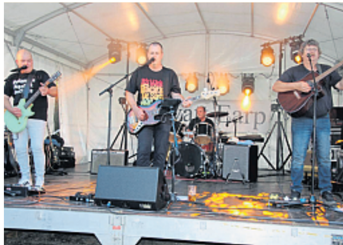
Musikalisch eröffnet werden die Jubiläumsfeierlichkeiten von „Wyatt Earp“.

Doch vor ein paar Jahren trat etwas ein, womit wohl nur die Wenigsten gerechnet hätten: Einige Jugendliche, alle nach 2000 geboren, begannen damit, alte, verstaubte Zweiräder aus den Scheunen zu bergen und wieder auf Vordermann zu bringen. Zunächst altersbedingt