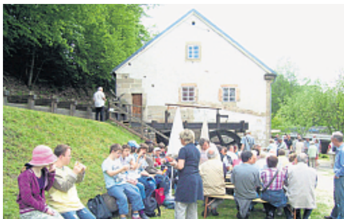
Beim 33. Deutschen Mühlentag am Pfingstmontag, 25. Mai, wird das Freilichtmuseum Scherzenmühle in der Weidenberger Au zum Besuchermagneten für Groß und Klein.

Am Nachmittag des Vatertages sorgen traditionell die Weiden-