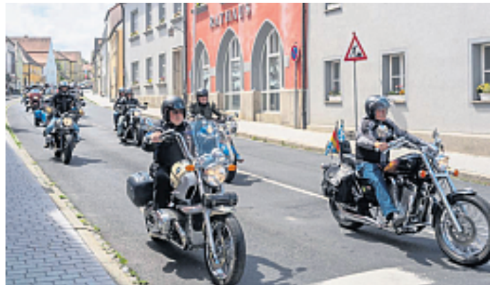
Durch die Region gehts bei der Benefizfahrt des GFP-Erbendorf.

Außerdem steht auf dem Programm Kinderbelustigung, Hüpfburg, entspannte Atmosphäre und natürlich Motorräder satt. Ein Highlight ist die Motorradrundfahrt, bei der dutzende Bikes gemeinsam durch die Region rollen. Der Eintritt ist das ganze Wochenende frei.