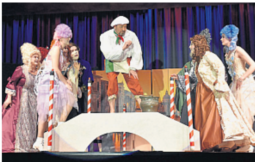
Die Musiktheaterklasse der Kreismusikschule liefert mit „Eine Nacht in Venedig“ ein buntes Spektakel.