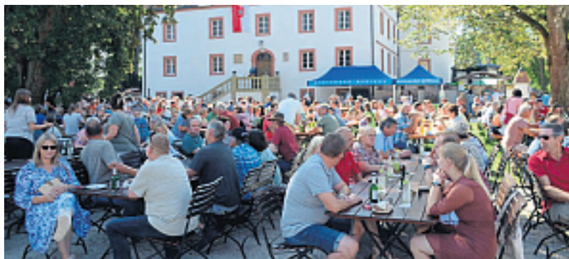
Die „Bio-Meile“ der Steinwald-Allianz ist regelmäßig ein Besuchermagnet.

Die Bio-Meile ist eine Veranstaltungsreihe der Öko-Modellregion Steinwald und wandert seit 2021 durch die Gemeinden der Steinwald-Allianz. Alle zwei Jahre – im Wechsel mit dem Waldhausfest – bietet sie Bio-Betrieben, Bio-Direktvermarktern, Partnern und Akteuren aus der Region eine Plattform, um ihre Arbeit vorzustellen und mit Besucherinnen und Besuchern ins Gespräch zu kommen. Ziel der Veranstaltung ist es zudem, ein Bewusstsein für ökologisch pro-