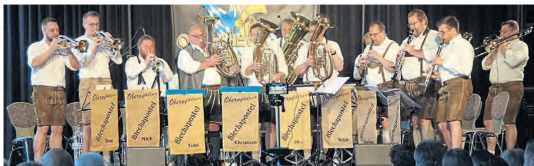
Die „Oberpfälzer Blechapostel“.

Nach einem musikalischen Frühschoppen im Pfarrgarten zum Erntedankfest, findet das Jubiläumsjahr mit einem Kirchenkonzert und der musikalischen Adventsfeier auf dem Kirchplatz zum Jahresende seinen Abschluss.