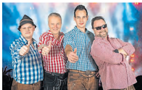
Die „Gseea Wepsn“.

Frühschoppen mit der Ehenbachtaler Blaskapelle eröffnet den Kirwasamstag, 14. Juni. Ab 15 Uhr steht das Austanzen der „Kirwakids“ und Kirwabau- maustanzen mit den Kirwapaa- ren auf dem Programm. Ab 17 Uhr unterhalten „Die Gseea Wepsn“ mit moderner Blasmusik das Publikum, das sich zudem ab 19 Uhr zum public Viewing versammeln kann. „Die Gseea Wepsn“ sorgen später auch bei der Afterparty für beste Kirwastimmung.