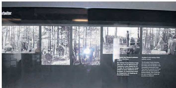
Im Ausstellungsgebäude der KZ-Gedenkstätte sind die Verbrechen der Nazis mit einer Vielzahl von erschütternden Fotos dokumentiert.