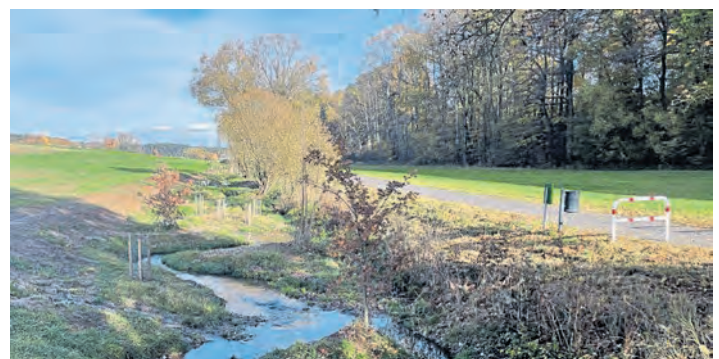
Der Eichelbach in Kohlberg wurde in zwei Abschnitten renaturiert. Im ersten Teil schlängelt er sich nun entlang eines Fahrradwegs.

Die Maßnahme bringt gleich mehrere Vorteile: Zum einen ist sie ein Gewinn für die Natur, Tiere und Pflanzen finden neue Lebensräume. Zudem bietet der Eichelbach nun Schutz bei Hochwasser. Wenn Starkregen fällt, kann der Bach mehr Wasser aufnehmen und länger in der Fläche halten. Die Gefahr von Überschwemmungen wird so geringer und die Grundstücke drumherum geschützt. Auch für das Grundwasser bringt die Renaturierung Vorteile, denn das langsam versickernde Wasser speist das Grundwasser – so bleibt der natürliche Wasserspeicher erhalten. Die Kosten für das Projekt betragen 85 000 Euro.