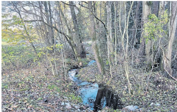
Ein Teil des Eichelbachs läuft durch einen Feuchtwald.

Initiiert hatte das Ganze der Landesbund für Vogel- und Naturschutz (LBV). 2016 kamen Experten des LBV im Rahmen des Projekts „Lebendige Bäche“ nach Kohlberg. Sie erkundeten den Eichelbach und stellten fest, dass es sinnvoll wäre, ihn wieder zu einem naturnahen, lebendigen Gewässer zu machen.