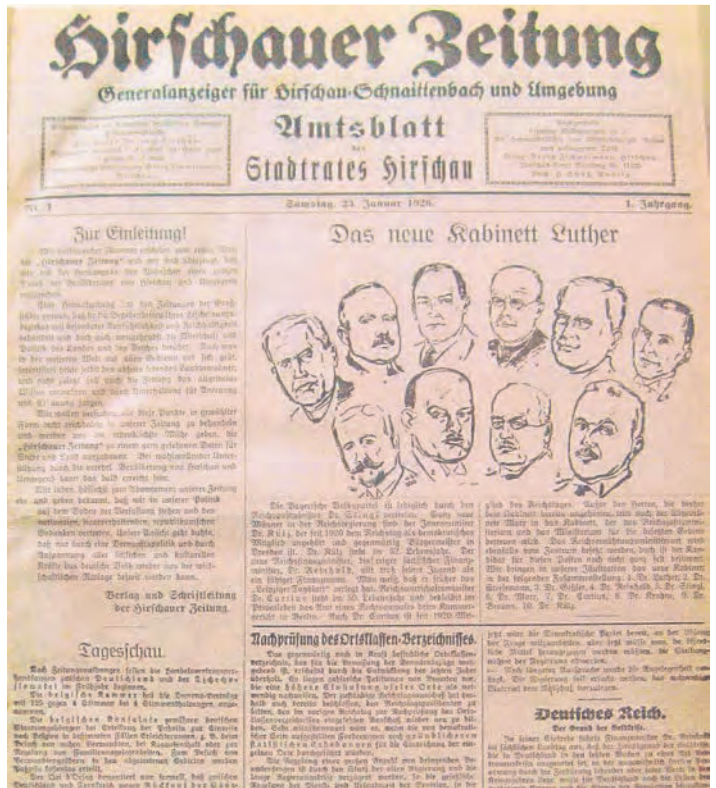
Am 23. Januar 1926 erschien die erste Ausgabe der „Hirschauer Zeitung“. Bemerkenswert die Aufschrift „Amtsblatt des Stadtrates Hirschau“.

Der genaue Zeitpunkt, wann die letzte Ausgabe der „Hirschauer Zeitung“ erschienen ist, lässt sich nicht ermitteln. Die Produktion des „Amberger Anzeigers“ wurde 1929 eingestellt.