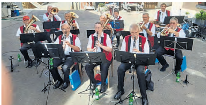
Die „Leuebube“ aus Zürich kommen zur Freudenberger Jakobikirwa im Juli.

Der Sonntag beginnt mit der Orchester-Messe auf dem Jakobiplatz. Anschließend übernehmen zum Frühschoppen die