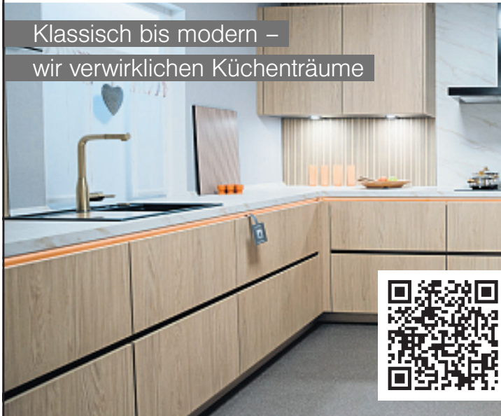
Klassisch bis modern – wir verwirklichen Küchenträume