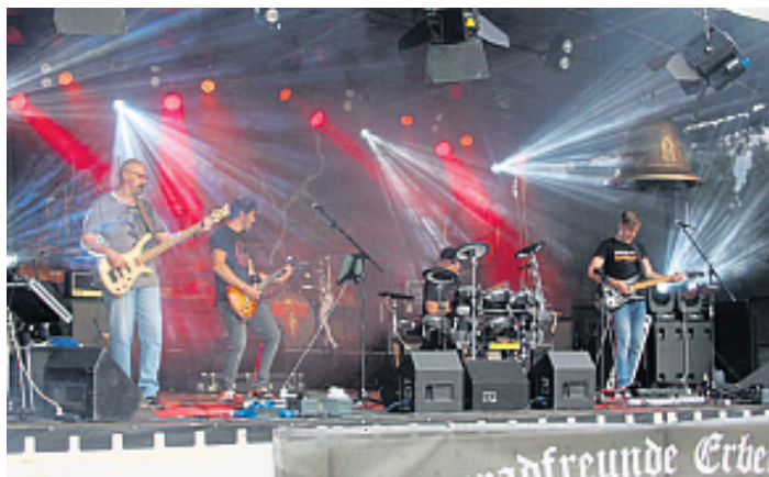
Beim Spendenfestival der Motorradfreunde Erbendorf stehen verschiedenste Bands auf der Bühne.

Erbendorf. (hfv) Die Motorradfreunde GFP Erbendorf organisieren in diesem Jahr wieder das Musikfestival „Rock 'n' Ride“. Dabei gibt es ein Wiedersehen mit einigen Gruppen, die schon im vergangenen Jahr den Rock- und Hardrock-Fans an der Rohrmühle mächtig eingeheizt haben. Vom 19. bis 21. Juni findet das Spendenfestival zugunsten des Kinderhospiz statt.