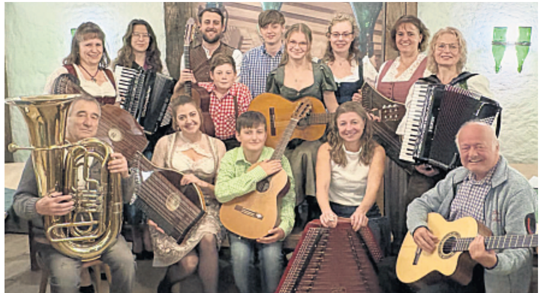
Stadtkapelle und Zitherclub musizieren am Sonntag, 19. Juli, im Erbendorfer Stadtpark.

Der Eintritt ist frei, Spenden sind willkommen. Im Park werden Sitzbänke aufgestellt und erfrischende Getränke angebo-