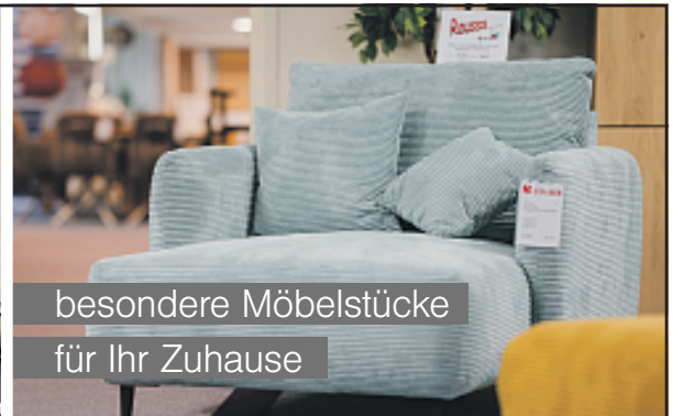
besondere Möbelstücke für Ihr Zuhause