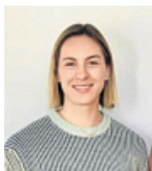
Alexandra Burghardt.

Rund 1000 Schülerinnen und Schüler aus Kemnath und Umgebung werden am Vormittag erwartet. Sie werden von Spitzensportlern und Sportbotschaftern der Sparkassen-Finanzgruppe unterstützt. Auch die Olympionikin Alexandra Burghardt hat ihr Kommen zu-