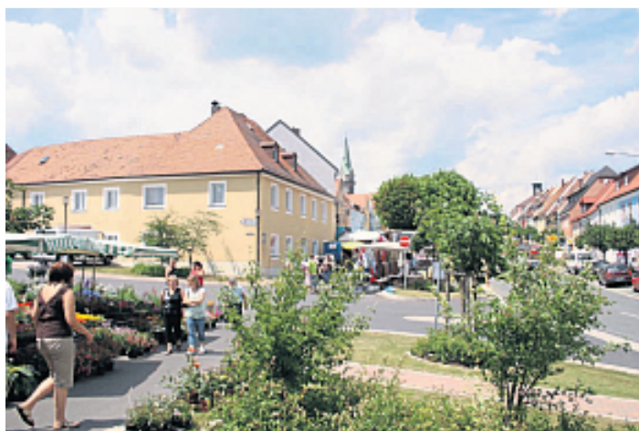
St.-Veits-Markt in Erbendorf – da laden wieder zahlreiche Fieranten an ihren Verkaufsständen zum „shoppen“ ein.

Beim St.-Veits-Markt wird ein breites Angebot an den Verkaufsständen am Unteren Markt zu sehen sein. Nicht zu vergessen dabei, der kulinarische Part sowie natürlich Süßes. Zahlreiche Geschäfte in der Innenstadt öffnen und laden zum verkaufsoffenen Sonntag ein. Zudem findet bereits am frühen Morgen ein Floh- und Trödelmarkt in der Südbahnhofstraße statt. Wer den Tag für ei-