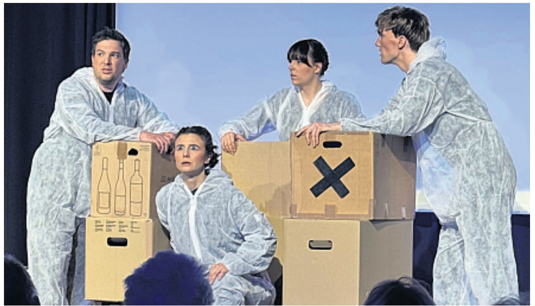
Mit der Aufführung des Theaterstücks „SAD-88“ gastierte das Ovigo Theater erstmals in Kemnath.

Kemnath. (bjp) Mit der Auf-führung des Theaterstücks „SAD-88“ gastierte das Ovigo Theater erstmals in Kemnath – und hat damit einen ein-drucksvollen Auftakt für die neue kulturelle Zusammenar-beit gesetzt. Im Foyer der Mehrzweckhalle Kemnath erlebten die Besucher einen intensiven Theaterabend. Das En-semble begeisterte mit intensi-ver Darstellung und großer Aus-druckskraft – Theaterkunst auf höchstem Niveau.