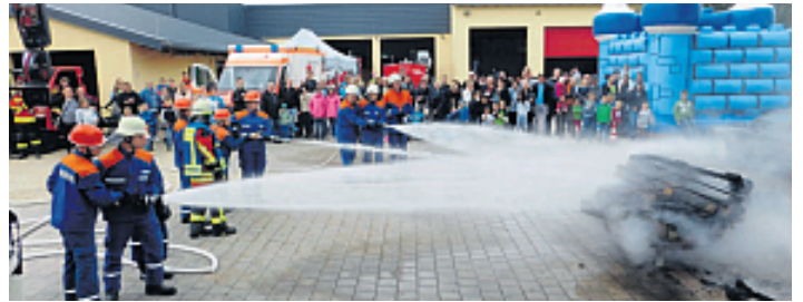
Ihre Einsatzfähigkeit stellt die Feuerwehr beim „Tag der offenen Tür“ unter Beweis.

Unterstützt von vielen fleißigen Helfern wird am Sonntag ab 13 Uhr die Feuerwehr Speichersdorf ihre Ausrüstung präsentieren und demonstrieren. Bei ei-