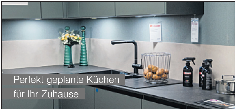
Perfekt geplante Küchen für Ihr Zuhause

Der Eintritt zu den Kirchweih-Veranstaltungen ist an allen Tagen frei.