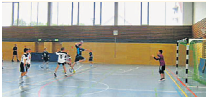
Die Hallensport-Abteilungen des TSV Kirchenlaibach stellen sich am 21. Juni vor.

Kirchenlaibach. (whü) Der TSV Kirchenlaibach/Speichersdorf feiert im Jahr 2026 sein großes 100-jähriges Vereinsjubiläum – und ein besonderes Highlight des Festjahres wird der „Tag des Hallensports“ am Sonntag, 21. Juni, in der Sportarena Speichersdorf sein. Von 13 bis 18 Uhr verwandelt sich die Halle in eine große Mitmach-Arena für Jung und Alt, bei der Sport, Bewegung und Gemeinschaft im Mittelpunkt stehen.