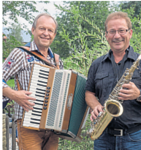
Unter anderem „d’Kleeblätter“ begleiten das Vereinsjubiläum des TSV musikalisch.