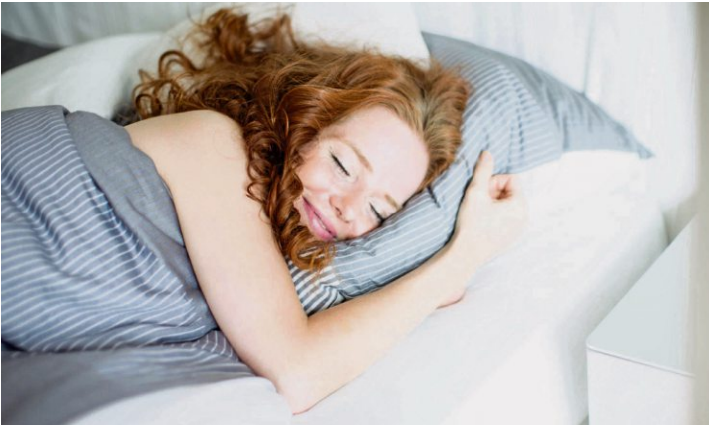
Schlafen ist alles andere als Zeitverschwendung.