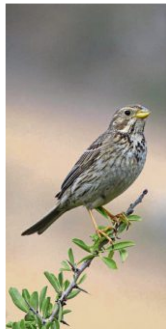
Bedrohte Vogelarten wie zum Beispiel die Grauammer kommen nicht zu einer Futterstelle im Garten.