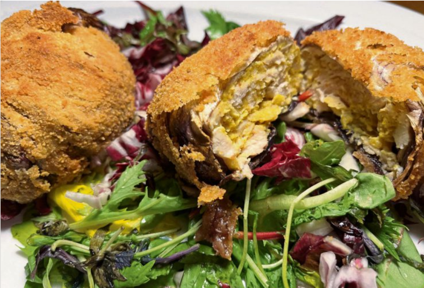
Der gefüllte Radicchio wird auf einem Salatbett und einer Soße mit Senf und Ahornsirup serviert.