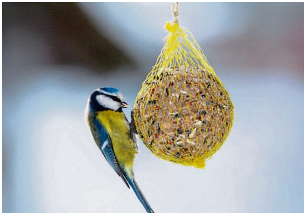
Auf keinen Fall Meisenknödel in Plastiknetzen verwenden, denn diese sind eine Gefahr für die Vögel.

Ihr Appell an alle Gartenbesitzer: „Es fängt schon damit an, im Herbst Stauden, Gras oder Disteln im Garten stehen zu lassen. Denn darin überwintern viele Insektenlarven – ein Leckerbissen für viele Vögel. Die Samen der stehengelassenen Stauden dienen Körnerfressern wie Finken als Nahrung. Auch ab-