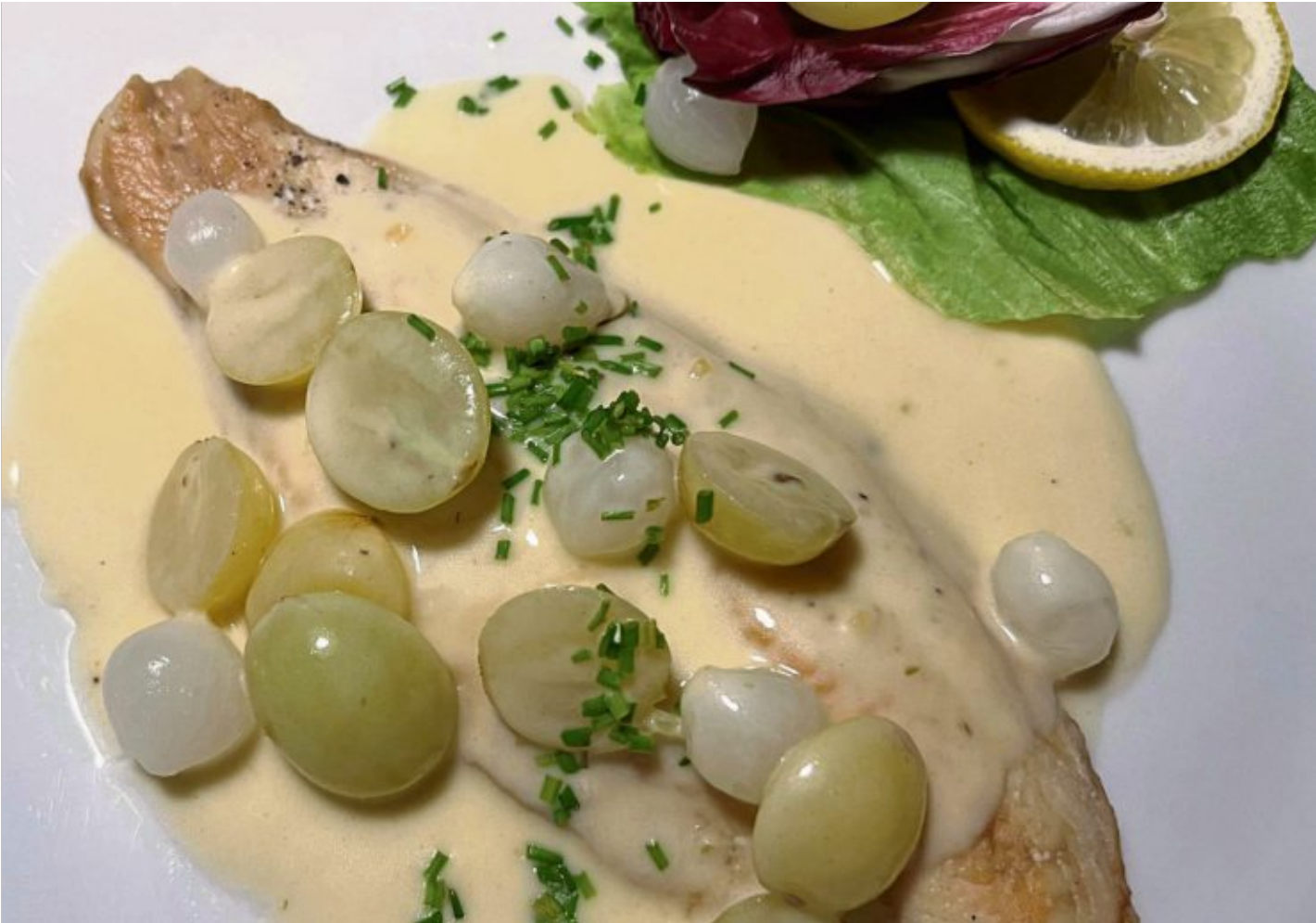
Die Fischfilets ziehen in einem Sud gar. OWZ-Küchenchef Michael Schiffer serviert sie mit einer Traubensoße.