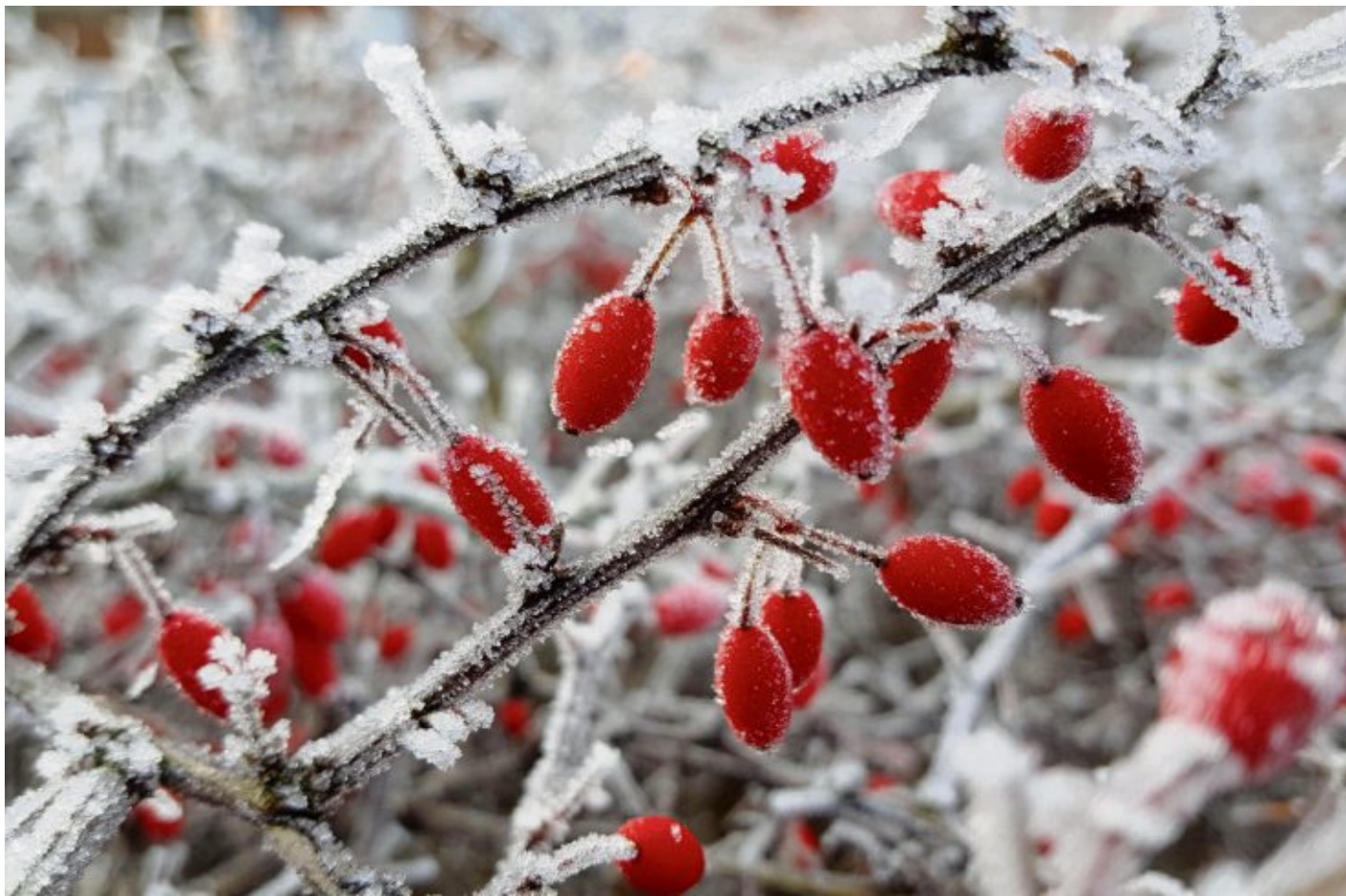
Die Berberitze ist in allen Jahreszeiten schön anzusehen und gilt als anspruchslos.

Alle Pflanzenteile des Kirschlorbeers enthalten giftige cyanogene Glykoside,