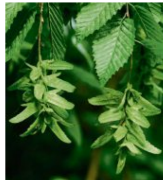
Die Hainbuche ist eine dichte, schnittverträgliche Heckenpflanze.

› Liguster ( Ligustrum vulgare ): Halbimmergrün (Abwurf der Blätter je nach Wintertemperaturen), mit Blüten für