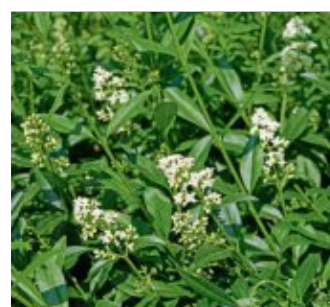
Liguster bietet Blüten für Insekten und Beeren für Vögel.