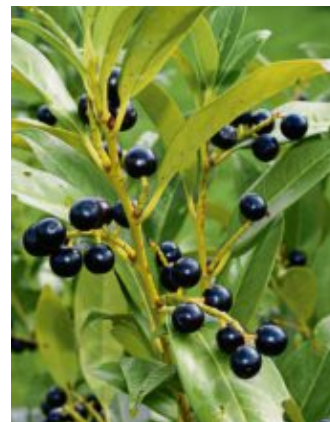
Der Kirschlorbeer gilt als ökologisch bedenklich.

› Berberitze ( Berberis vulgaris ): Anspruchsloser, dornenbewährter, heimischer Strauch mit schönem Herbstlaub. Bietet Schutz und Nist-