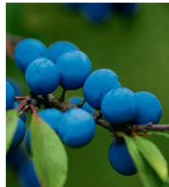
Die Schlehe ist ein Frühblüher für Bienen, dornig und daher ein guter Schutz für Vögel.