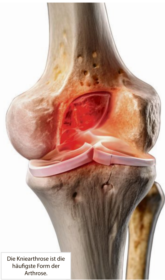
Die Kniearthrose ist die häufigste Form der Arthrose.

Arthrose – die wichtigsten Fakten Arthrose gilt als eine Verschleißkrankheit der Gelenke, bei der sich der Knorpel an den Gelenken abnutzt. Dieser Knorpel bildet eine Schutzschicht, die verhindern soll, dass die Knochen aneinander reiben. Nutzt sich der Knorpel ab, reiben schließlich die Knochen ungeschützt aneinander. Dies führt zu starken Schmerzen und Entzündungen. Altersbedingter Verschleiß gilt dabei als eine der Hauptursachen. Aber auch Bewegungsmangel, Übergewicht oder Fehlstellungen können Arthrose begünstigen. Ein typisches Zeichen ist der „Anlaufschmerz“. Dabei verspüren Betroffene beim Loslaufen auf den ersten Metern ein Ziehen, z.B. in der Hüfte oder im Knie. Arthrose beginnt außerdem in vielen Fällen damit, dass sich die Gelenke steif anfühlen oder anschwellen. Später kommt häufig ein Belastungsschmerz hinzu.