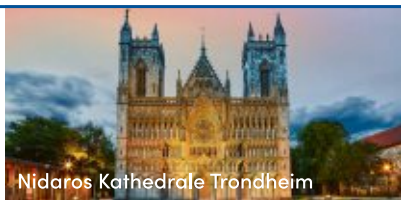
Nidaros Kathedrale Trondheim