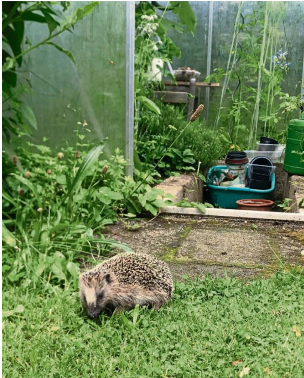
Igel fühlen sich besonders in naturbelassenen Gärten mit Rückzugsorten wie Laub- und Totholzhaufen sehr wohl. Auch ein Gewächshaus kann als Unterschlupf infrage kommen.

Gleichzeitig sind Hecken, hohes Gras sowie Laub- und Totholzhaufen ideale Lebensorte und Winterquartiere. Als Insektenfresser leisten