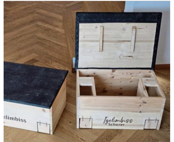
So sieht ein Futterhaus für Igel aus.

sätzlich, ihn möglichst sanft zu pflegen. Auf chemische Pflanzenschutzmittel und Schneckenkorn sollte man verzichten. Ebenso empfiehlt Schröppel, Mähroboter nur tagsüber laufen zu lassen. Im Dunkeln seien sie eine potenzielle Gefahr für die nachtaktiven Stacheltiere. „Gar nicht erst benutzen wäre natürlich noch besser. Durch die täglichen Fahrten entstehen tote Flächen, auf denen keine Insekten mehr überleben können.“