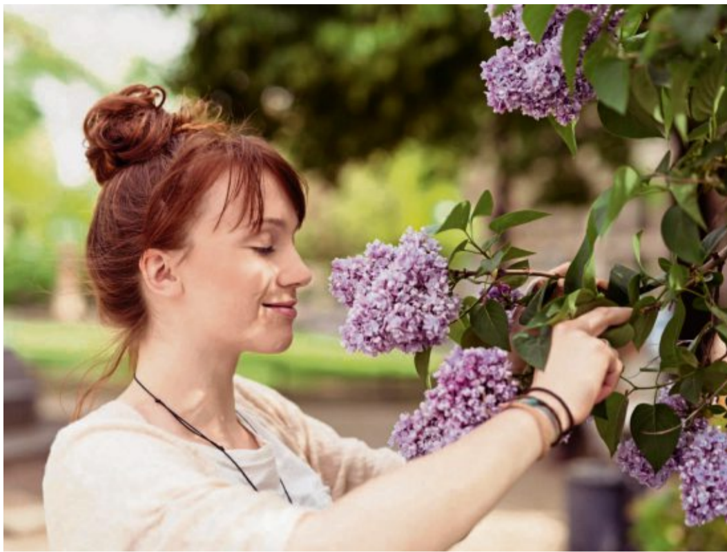
Die gute Nachricht ist: Wir können lernen, uns selbst zu lieben.

Was antworten Sie eigentlich auf die Frage, wen Sie lieben? Vielleicht nennen Sie zuerst Ihren Mann oder Ihre Frau? Ihre Kinder? Ihre Geschwister oder besten Freunde? Sich selbst haben Sie jetzt aber bestimmt bei der Aufzählung vergessen, richtig? Vielen von uns fällt es leicht, andere Menschen zu lieben. Bei uns selbst landen wir dann schnell in einer Art Sackgas-