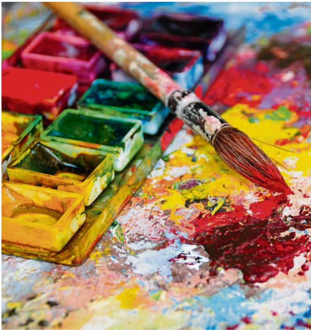
Malen entspannt und versetzt uns in die Kindheit zurück.

„Während ich male, lasse ich meinen Körper draußen vor der Tür, wie die Moslems ihre Schuhe vor der Moschee“, sagte Pablo Picasso einmal. Der spanische Künstler schuf nicht nur einzigartige Werke, sondern kannte auch die positive Wirkung des Malens auf die Seele. Die gute Nachricht ist: Wir müssen dafür kein Picasso sein. Denn für die positive Wirkung ist es ziemlich egal, ob wir einfach nur Bilder ausmalen oder selbst kreativ