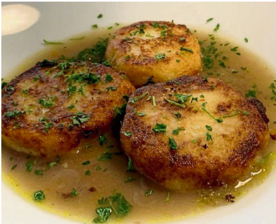
Die gebratenen Graukaslaibchen werden in der Einbrennsuppe serviert.

Zubereitung: Für die Einbrennsuppe etwas Öl in einem Topf erhitzen, Zwiebeln zugeben und leicht andünsten. Dann das Mehl einrühren und weiterdünsten bis die Einbrenn-Farbe annimmt, ohne anzubrennen. Mit der Rinderbrühe aufgießen und zum Kochen bringen. Salz,