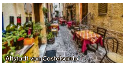
Altstadt von Castelsardo