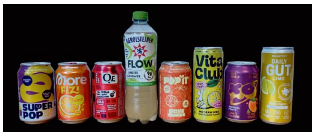
Eine Ballaststoff-Limo ersetzt keine Linsensuppe.

High-Fiber-Drinks sind vor allem ein Marketingprodukt mit hohem Preis. Die Getränke kosten im Durchschnitt fünf Euro pro Liter. Wer mehr Ballaststoffe aufnehmen möchte, sollte vor allem auf Vollkornprodukte, Hülsenfrüchte, Obst und Gemüse setzen. (exb)