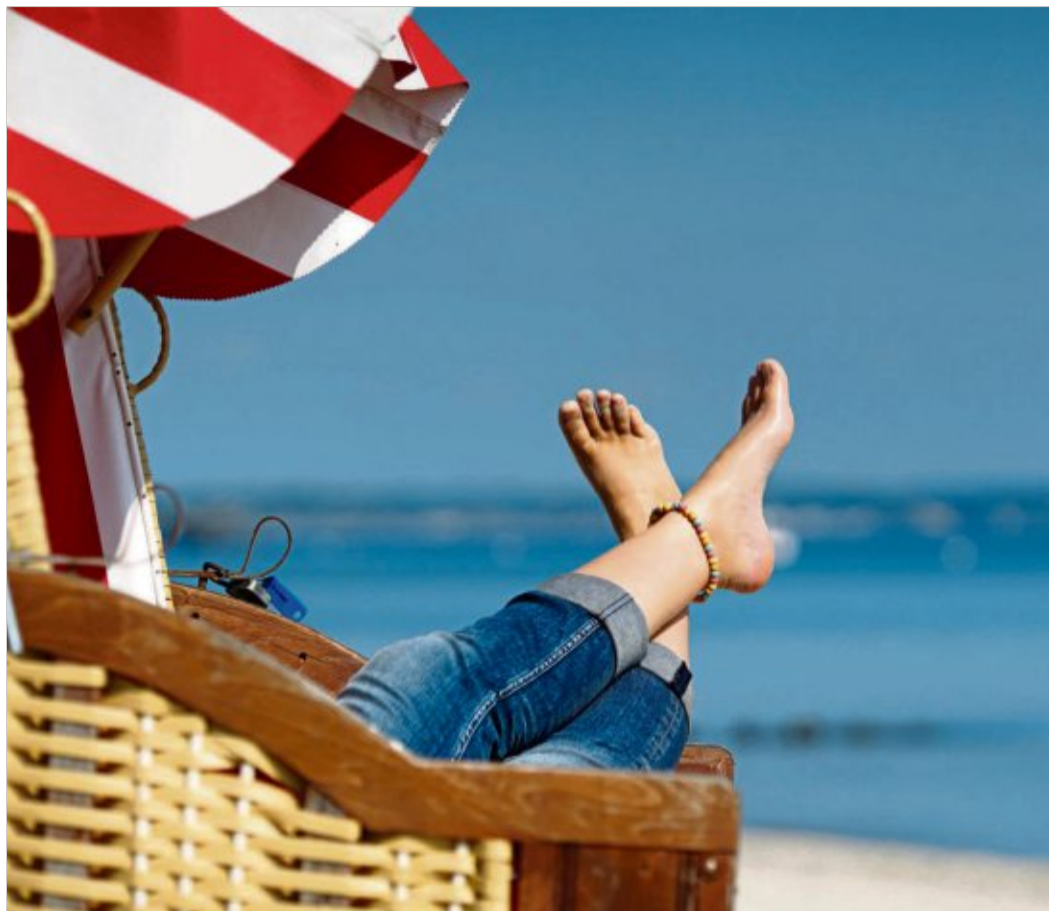
Die Füße hoch – es ist Urlaubszeit. Aber haben Sie auch Ihre Urlaubsansprüche im Blick?

Nach dem Wortlaut des Bundesurlaubsgesetzes gilt eigentlich, dass Urlaub im laufenden Kalenderjahr zu nehmen ist. Eine Übertragung erfolgt nur ausnahmsweise bis 31. März des Folgejahres. Dieser Grundsatz besteht formal weiterhin. Doch die aktuelle Rechtsprechung hat ihn praktisch relativiert. Hartmann: „Der Urlaub verfällt nicht mehr automatisch. Das BAG verlangt inzwischen ausdrücklich eine konkrete Information des Arbeitgebers an den Mitarbeitenden über den Urlaubsanspruch, verbunden mit einer individuellen Aufforderung, den Urlaub in Anspruch zu nehmen, sowie den klaren Hinweis auf den sonst drohenden Verfall des Urlaubsanspruchs.“ Halte sich der Arbeitgeber nicht an diese Vorgaben, bleibe der Urlaub weiterhin bestehen. Er verfalle nicht. Hinzu kommt: Die Beweislast liegt laut Hartmann beim Arbeitgeber. Er muss nachweisen, dass er die oben genannte ordnungsgemäß erfüllt hat. Fehlt dieser Nachweis, drohen ihm gegebenenfalls hohe Urlaubsabgeltungsansprüche bei Beendigung eines Arbeitsverhältnisses. Außerdem sei es in diesem Fall für den Arbeitgeber nur erschwert möglich, Verjährung der Urlaubsansprüche geltend zu machen. Denn auch hier gelte: Die Verjährung von Urlaubsansprüchen beginnt erst, wenn der Arbeitgeber seine Mitwirkungspflichten erfüllt hat.