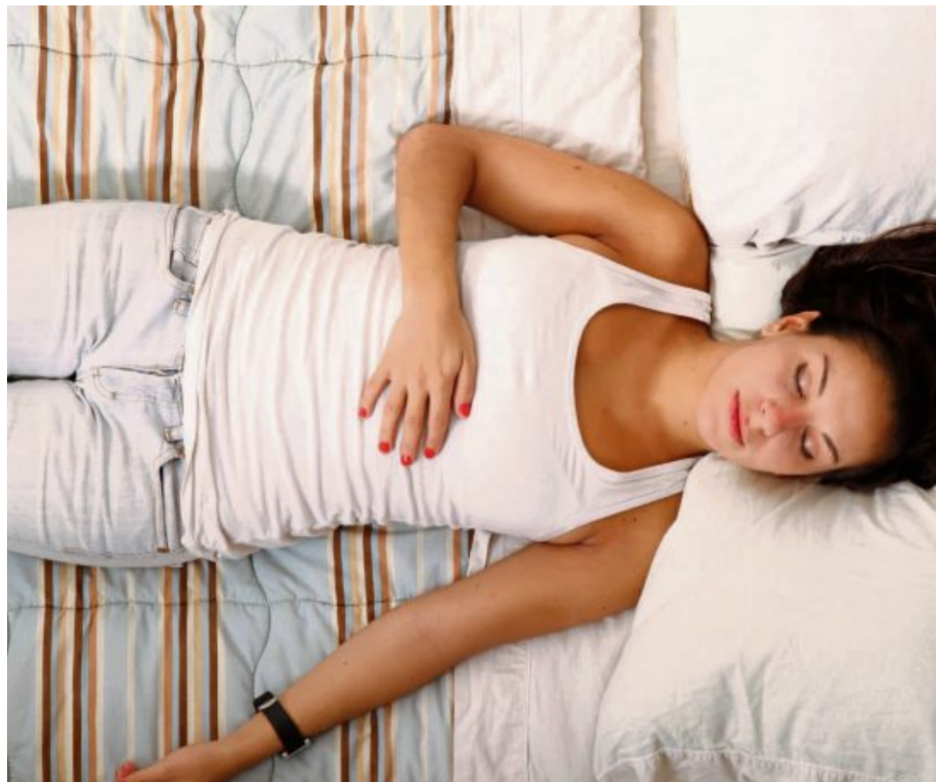
Wichtig für unser Glück ist es, dass wir genug Schlaf bekommen.

„Glück besteht darin, genug Schlaf zu bekommen. Nur das, mehr nicht.“ Der amerikanische Schriftsteller Robert A. Heinlein hatte seine ganz eigene Definition vom Glück. Aber so falsch lag er damit gar nicht. Denn Schlaf und