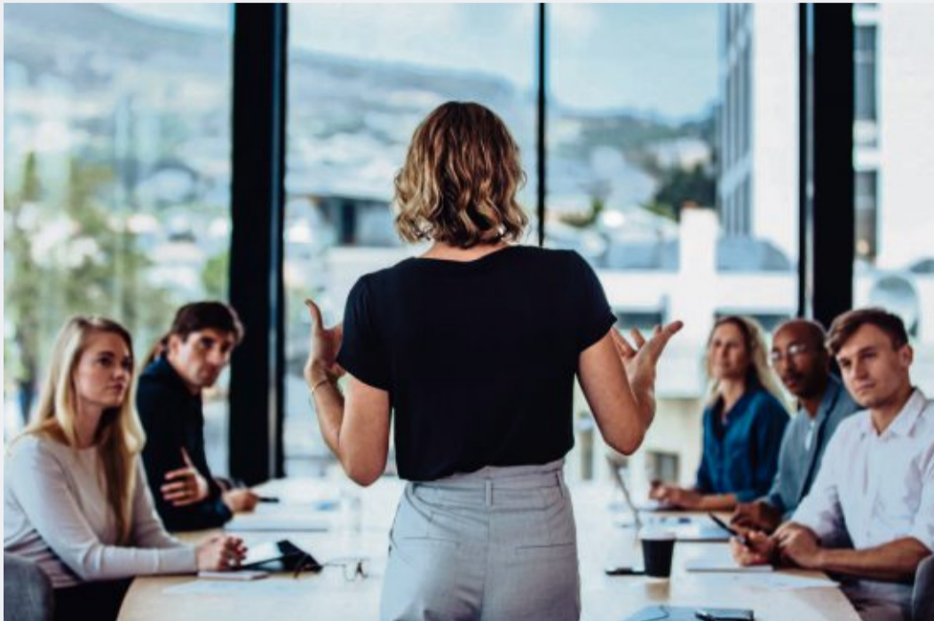
Dialogstärke ist eine wichtige Fähigkeit für Menschen in mittleren Führungspositionen.