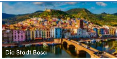
Die Stadt Bosa