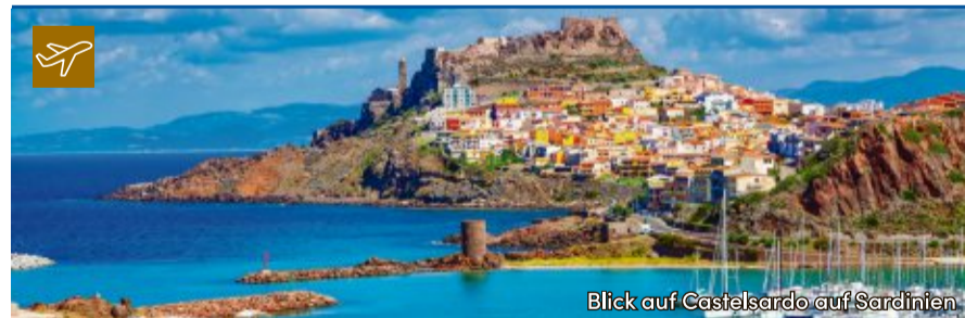
Blick auf Castelsardo auf Sardinien