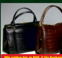
Wir zahlen bis zu 800,-€ für Krokotaschen