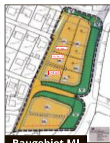
Baugebiet MI „Am Mühlweg“

Infos auch unter www.pechbrunn.de/leben/bauen-wohnen/baugebiete