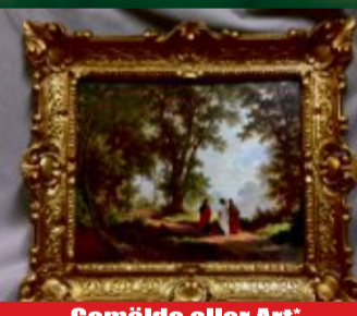
Gemälde aller Art*