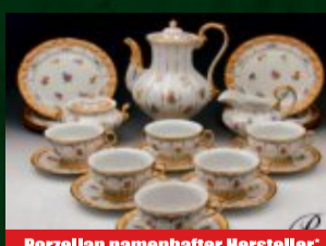
Porzellan namenhafter Hersteller*