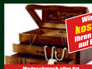
Modeschmuck aller Art

Wir prüfen kostenlos Ihren Schmuck auf Echtheit!