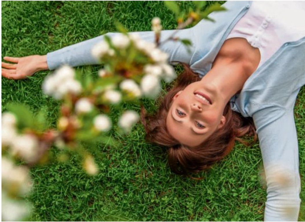
Jetzt im Mai fällt es besonders leicht, das Leben zu genießen.

Es fängt schon morgens beim Aufwachen an. Wir hören die Vögel vor unserem Fenster zwitschern und brau-