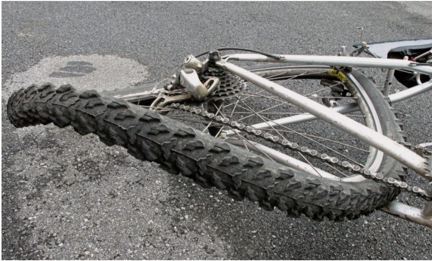
Das Gutachten stellt fest, ob das Fahrrad verkehrssicher instandgesetzt werden kann oder ob ein wirtschaftlicher Totalschaden vorliegt.

„Ein Sachverständigengutachten dient zunächst der vollständigen und objektiven Feststellung aller unfallbedingter Schäden“, erklärt Hecht. Neben offensichtlichen Beschädigungen, wie verbogene Felgen, beschädigte Anbauteile oder Lackschäden können auch versteckte Schäden auftreten, wie etwa