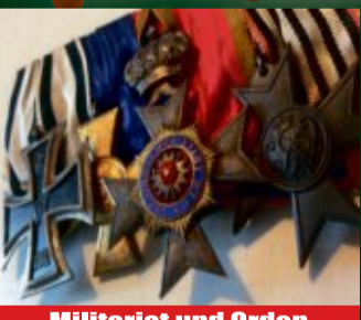
Militariat und Orden