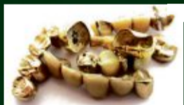
Zahngold (auch mit Zahn)