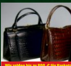
Wir zahlen bis zu 800,-€ für Krokotaschen