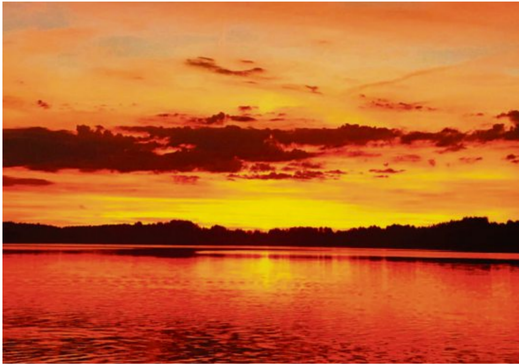
Ein Sonnenuntergang ist immer wieder ein faszinierendes Schauspiel.

„Der Himmel malt die schönsten Bilder“, sagt ein Sprichwort so treffend. Und ganz besonders lohnt sich ein Blick in den Himmel am Abend. Dann, wenn sich der Tag farbenfroh verabschiedet. Orangefarbenes Licht, rosa Wolken und ein feuerroter oder violetter Himmel. Ein Sonnenuntergang ist immer wieder ein faszinieren-