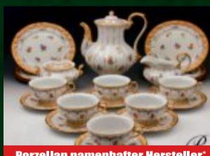
Porzellan namenhafter Hersteller*