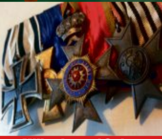
Militariat und Orden