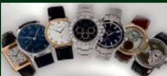
Markenuhren aller Art