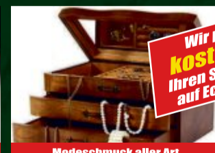
Modeschmuck aller Art

Wir prüfen kostenlos Ihren Schmuck auf Echtheit!