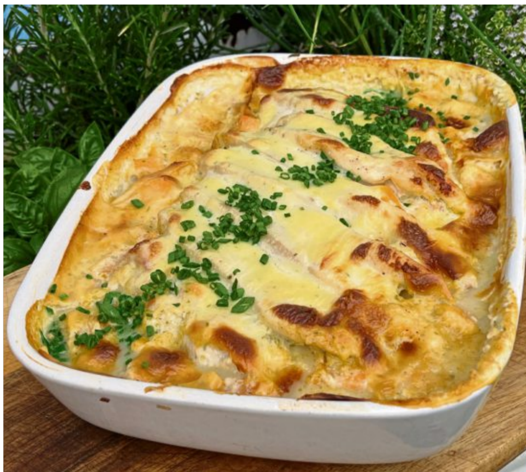
Das Gratin aus Geflügel mit Kürbis lädt zum Nachkochen ein.

In der Zwischenzeit die Zwiebeln schälen, fein hacken und das Kürbisfleisch würfeln. Beides in eine Schüssel