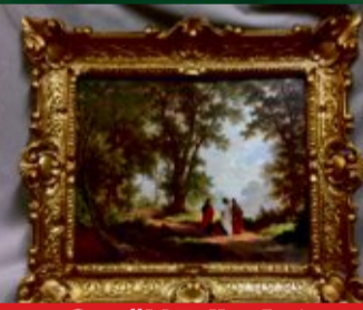
Gemälde aller Art*