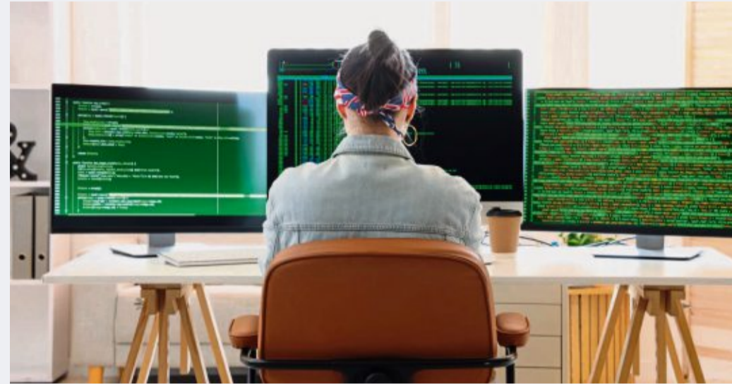
Für ITler kann KI-Wissen neue Chancen eröffnen.

Doch die Realität ist komplexer. KI ist kein Ersatz, sondern ein Werkzeug – ein