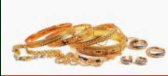
Goldschmuck aller Art