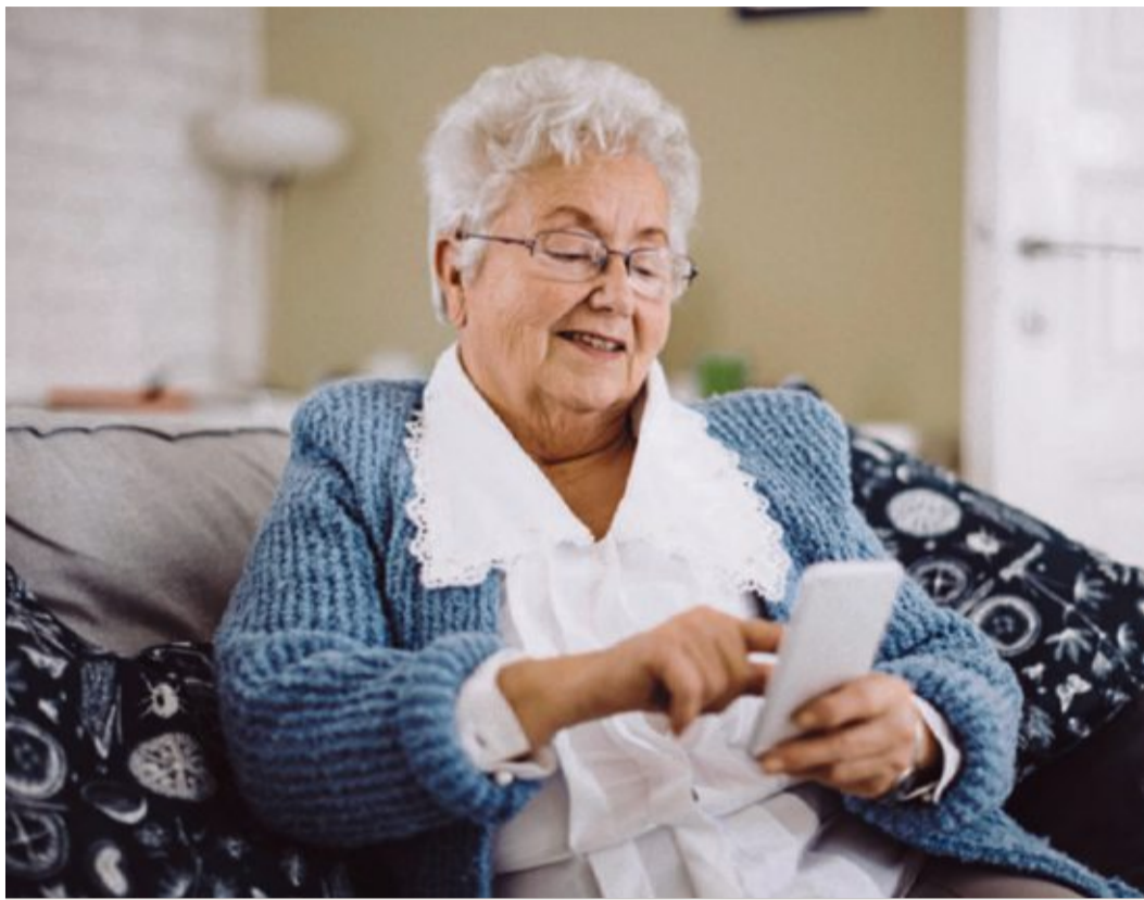
Ein Pflegeantrag kann bei einigen Krankenkassen online beantragt werden.