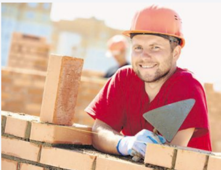
Die Arbeit am Bau macht Spaß.

Es beginnt oft mit der gemeinsamen Bewältigung von Herausforderungen. Ob bei strengem Frost, sengender Hitze oder unter Zeitdruck: Auf der Baustelle zählt jeder auf jeden. Die Arbeit ist körperlich anstrengend, die Bedingungen nicht immer einfach, und genau das schweißt zusammen. Man teilt nicht nur den Schweiß und die Müdigkeit, sondern auch die kleinen und großen Erfolge. Ein fertiggestelltes Dach, ein stabiler Fundamentguss oder ein gelungenes Projekt – diese Momente werden gemeinsam gefeiert, und sie schaffen eine Verbindung,