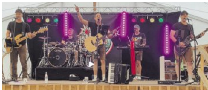
Mit Stimmungsmusik, Party- und Charthits unterhält „Heimatfieber“ das Publikum beim Rathausfest in Altenstadt/WN.

Ab 17 Uhr wird die Partyband „Heimatfieber“ mit ihrem großen Repertoire die Besucher unterhalten. Mitreißende Party-