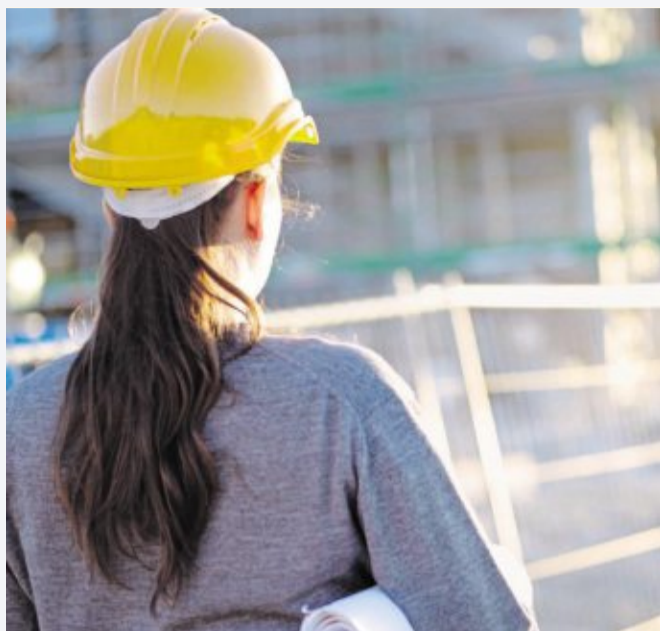
Frauen haben in Handwerk und auf dem Bau gute Perspektiven.