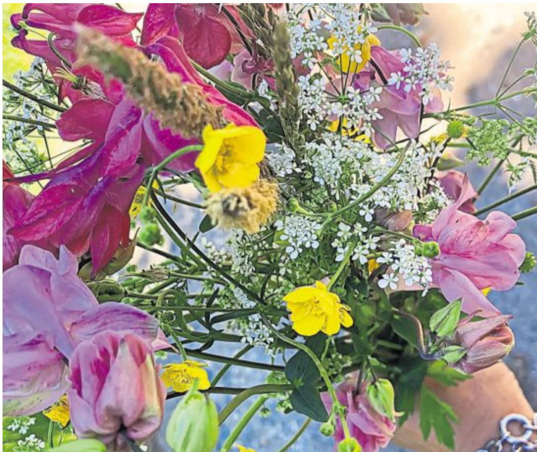
Wir alle freuen uns über einen bunten Blumenstrauß.

Inzwischen gibt es zahlreiche Tests und Studien, die die Wirkung von Blumen auf unser Gemüt belegen. Eine Studie findet sich zum Bei-