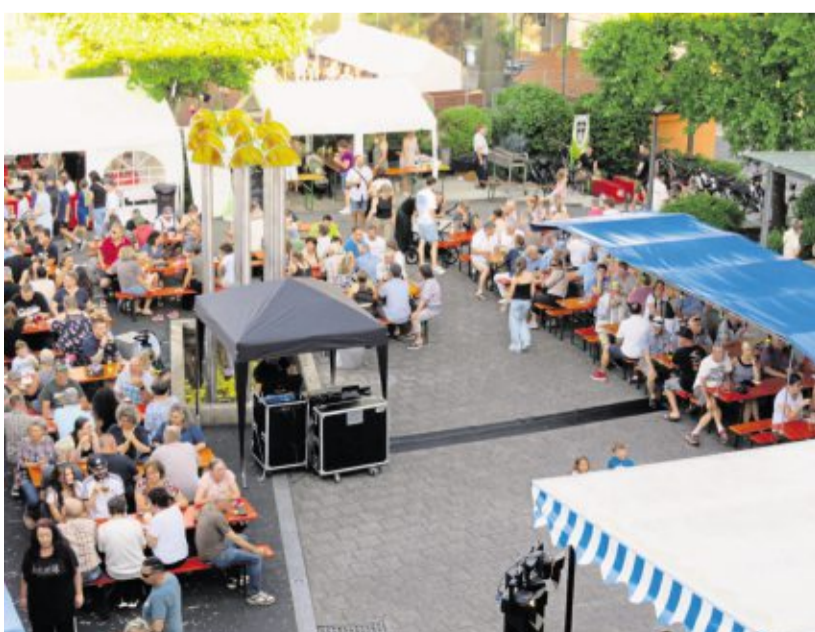
Rund ums Rathaus wird in Altenstadt/WN am Samstag, 27. Juni, ab 16 Uhr gefeiert.