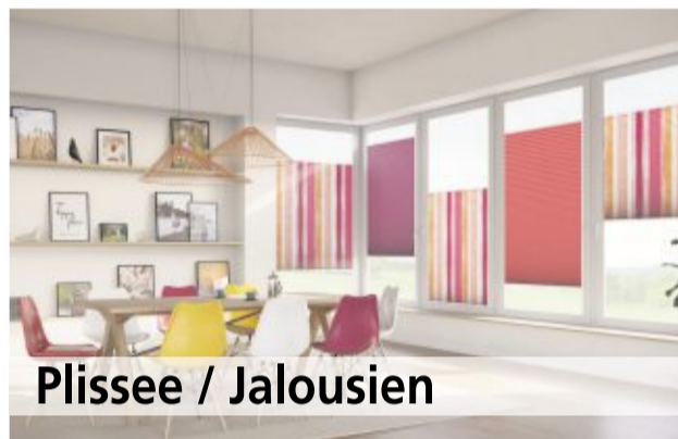
Plisse / Jalousien