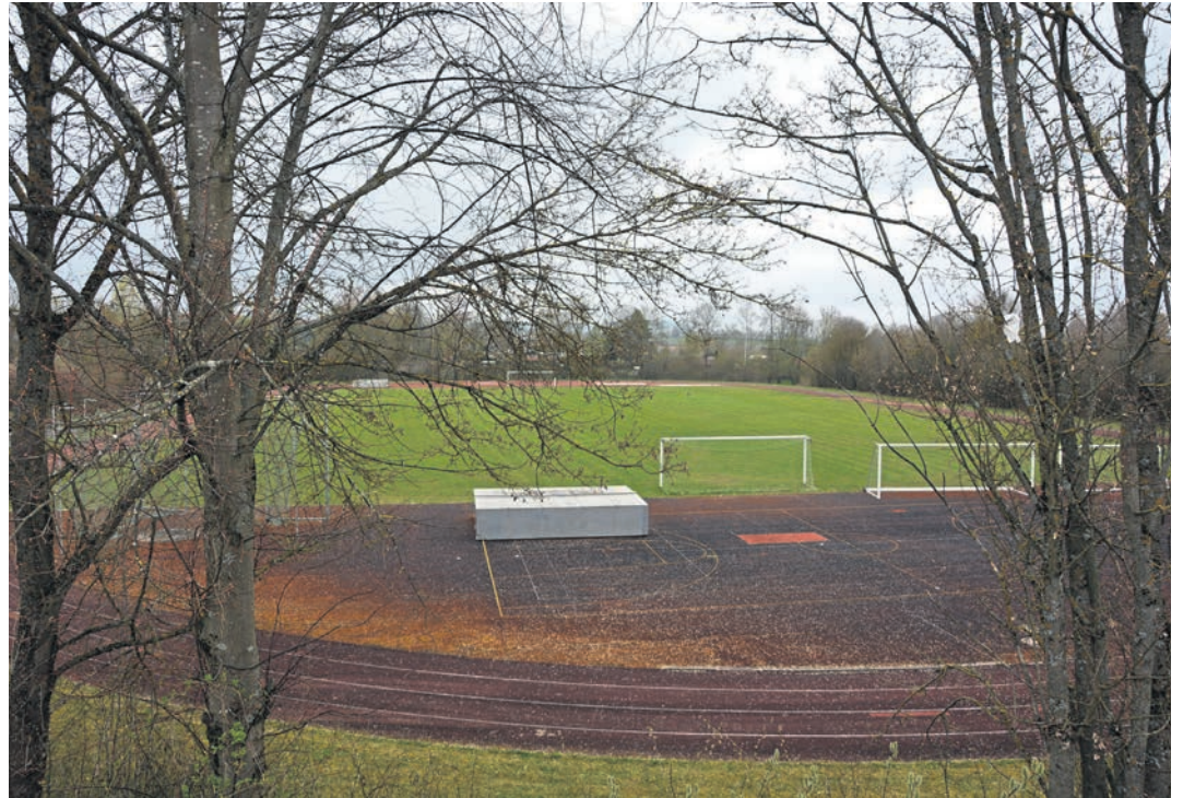
Die Außensportanlage im Schulzentrum soll heuer für 2,2 Millionen Euro auf Vordermann getrimmt werden, Baubeginn soll im Mai sein. (jr)

Der Verwaltungshaushalt beträgt heuer 21.135.100 Millionen Euro, der Vermögenshaushalt 11.036.100