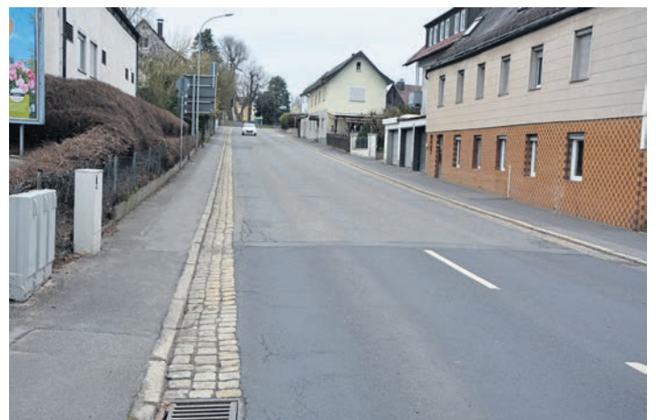
In der Wiesauer Straße werden die Wasser- und Abwasserleitungen für 2,65 Millionen Euro komplett erneuert. Die Arbeiten sollen demnächst beginnen und noch heuer fertiggestellt werden. (jr)

sowie für zwei Feuerwehrfahrzeuge für die Wehren Großensterz und Mitterteich. Großen Wert legt der Bürgermeister auf Zukunftsthemen in Sachen Energie. Derzeit laufen Planungen für mehrere Projekte, die insgesamt 15 Mega-Watt-Strom erzeugen können. Leicht gestiegen sind die Ausgaben für das Personal auf nunmehr 4.079 Millionen Euro, die Kreisum-