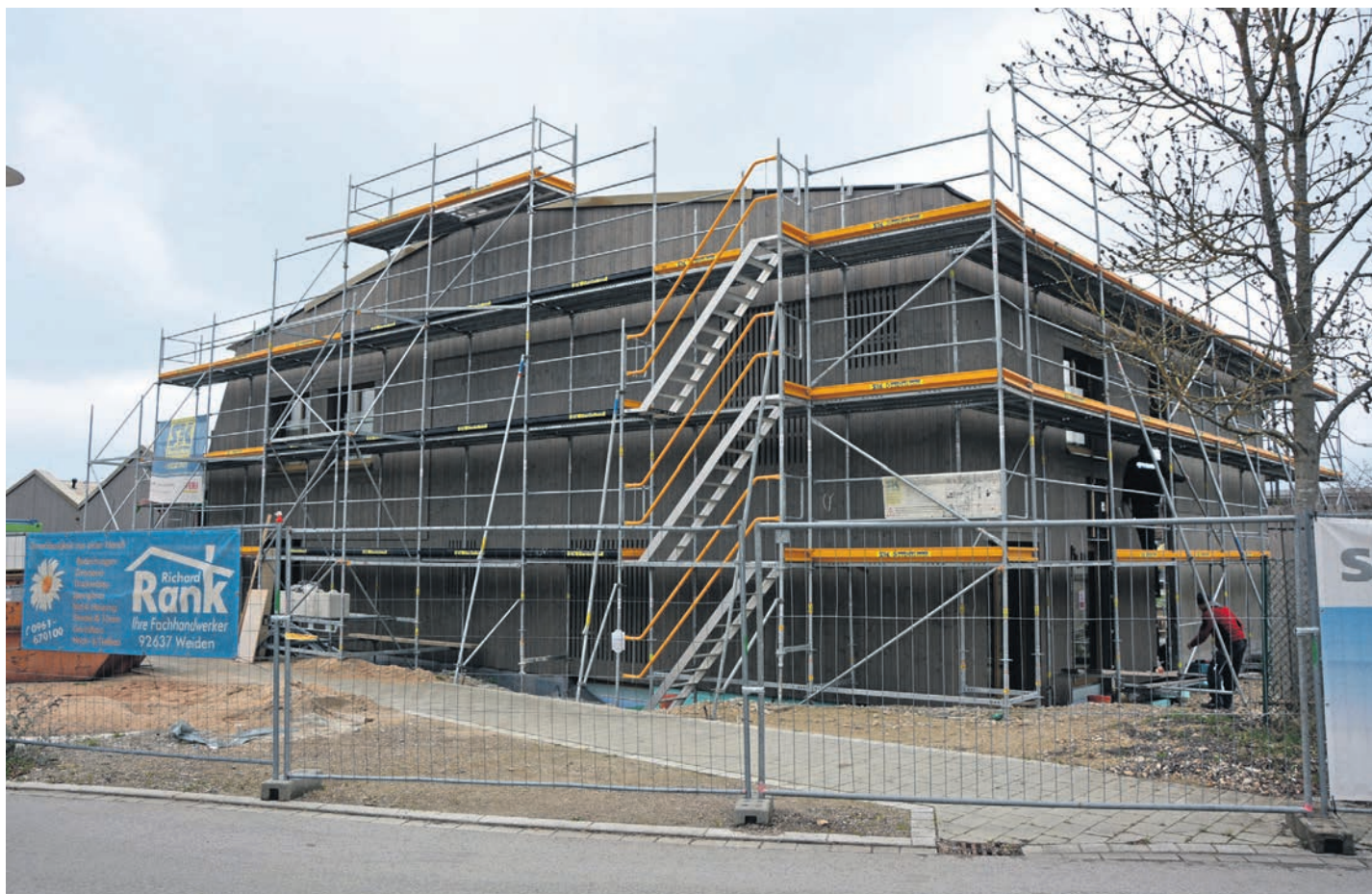
Noch heuer fertiggestellt werden soll der Anbau an das Kinderhaus „Purzelbaum“, im Haushalt sind weitere 2,5 Millionen Euro eingeplant. (jr)

lage liegt bei 3,942 Millionen Euro und damit um fast 1,2 Millionen Euro weniger als im Vorjahr. „Wir nehmen für heuer keinen Kredit auf, unsere Pro-Kopf-Verschuldung sinkt zum Jahresende auf dann 657 Euro pro Person“, sagte der Bürgermeister. In den vergangenen drei Jahren wurden drei Millionen Euro an Schulden abgebaut, die Pro-Kopf-Verschuldung sank um 550 Euro.