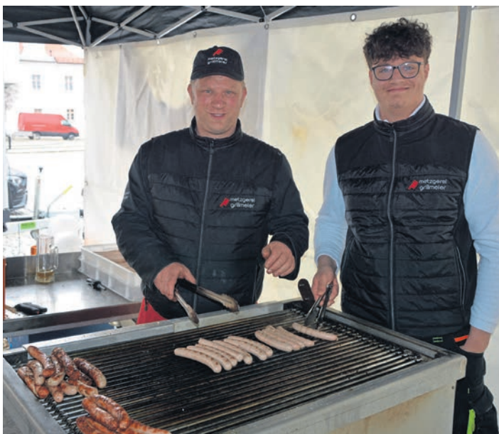
Gegrilltes gab es von der Metzgerei Grillmeier am Unteren Marktplatz. (jr)