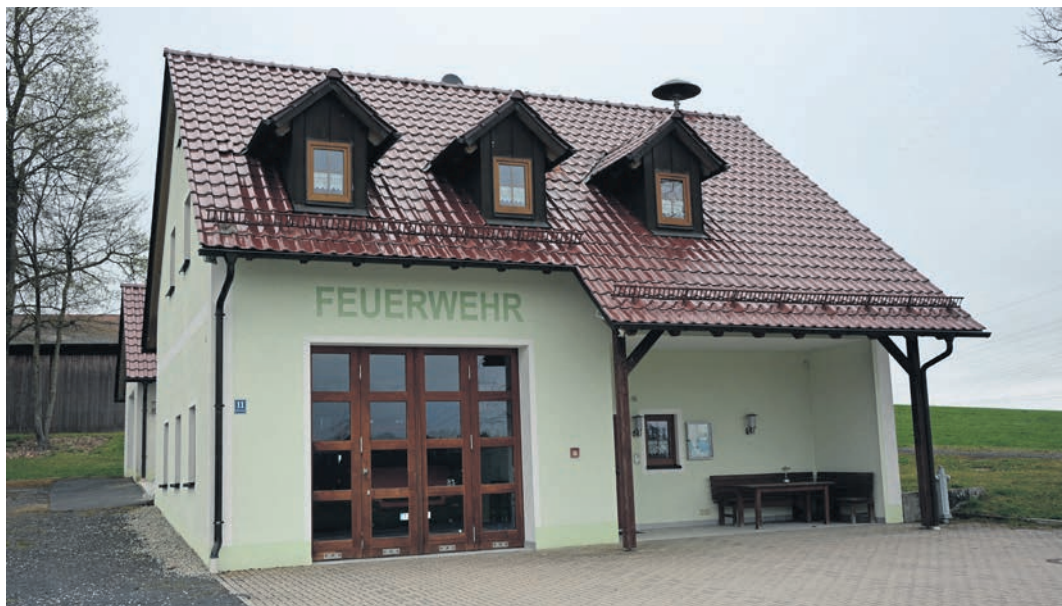
Herzstück der Feuerwehr Pechofen ist das Feuerwehrgerätehaus in Oberteich. Am Pfingstwochenende feiert die Wehr ihren 125. Geburtstag, wozu die gesamte Bevölkerung eingeladen ist. (jr)

Gefeiert wird mit einem Festgottesdienst und zweitägigen Gartenfest