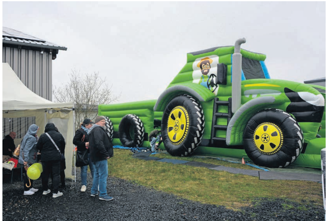
Auch den Kindern gefiel es, kein Wunder bei diesem Angebot.