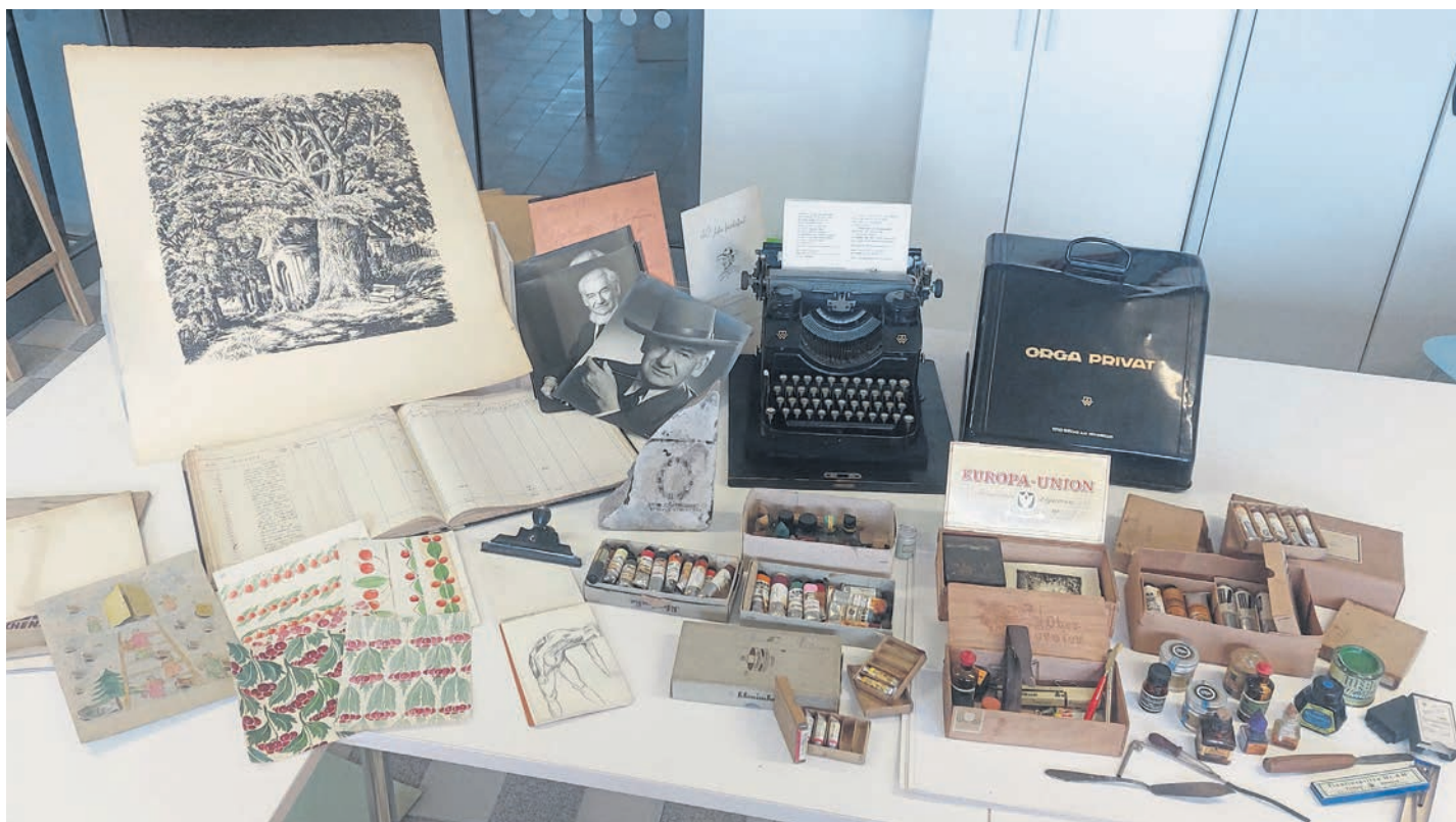
Das Foto zeigt eine grobe Zusammenstellung der Fundstücke aus dem Haus Molwitz in Tirschenreuth

Der Kupferstecher und Radierer Herbert Molwitz wurde vor 125 Jahren geboren