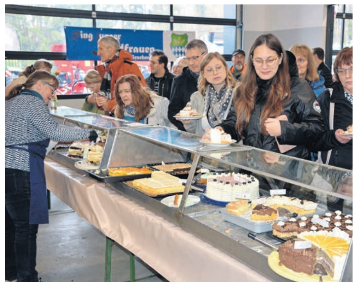
Alle Hände voll zu tun hatte der Ring junger Landfrauen, fast einhundert selbstgebackene Kuchen standen im Angebot.