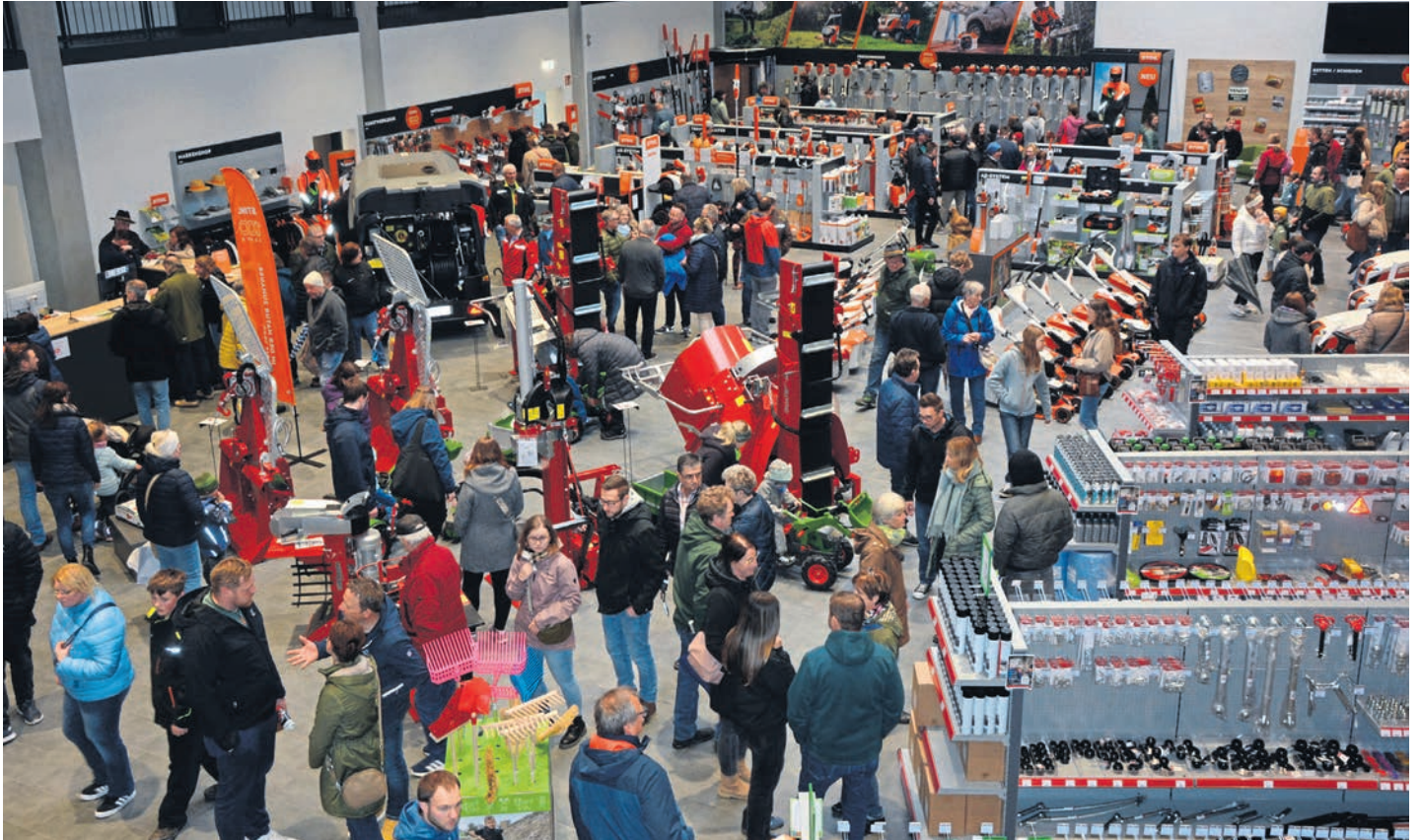
Blick in die neue Verkaufsabteilung der Raiffeisen Waren GmbH Nordoberpfalz, dort gab es am Sonntagnachmittag kaum ein Durchkommen. (jr) Bild: jr

Über 10000 Besucher bei Mitterteicher Gewerbeschau und Tag der offenen Tür der Raiffeisen Waren GmbH Nordoberpfalz und dies trotz wenig einladenden Wetters. Besucher aus der ganzen Region