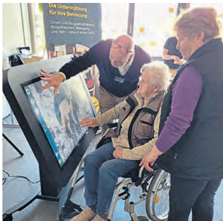
Großes Interesse weckte die Vorstellung des Care Tables.

barschaftshilfe deckte wieder alle Anforderungen ab. Mehrere Teilnehmer wünschten sich, dass diese Art der Zusammenkünfte in Zukunft öfter stattfinden sollte.