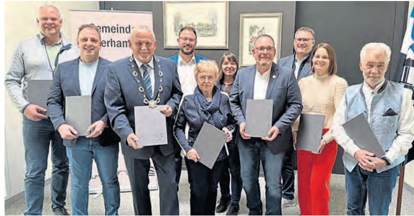
Bürgermeister Ludwig Biller (mit Amtskette) sowie einige Gemeinderäte wurden in der April-Sitzung verabschiedet.

Weiter verwies er auf die Entwicklung der Hauptstraße mit dem Rathaus, dem Hotel am See, der Firma GKS, dem Ärztehaus und dem Nahversorgungs-