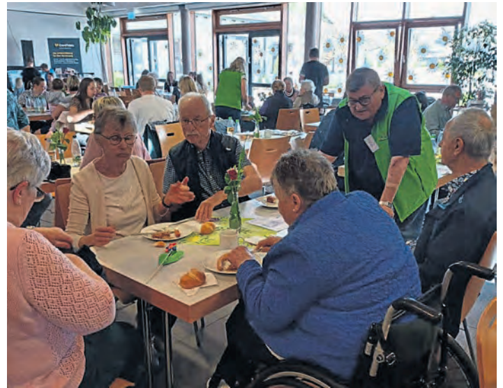
Der Begegnungstag war ein voller Erfolg.

Das musikalische Highlight war der Auftritt von „Ritmo Vulcani-