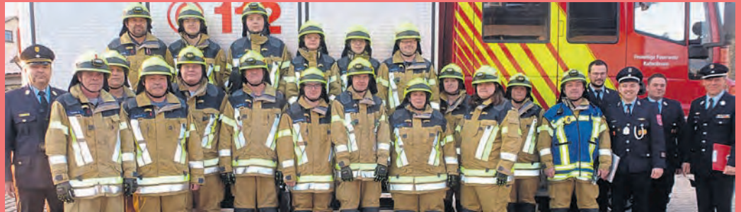
Die erfolgreichen Teilnehmer der Leistungsprüfung mit Schiedsrichtern und Ausbildern.