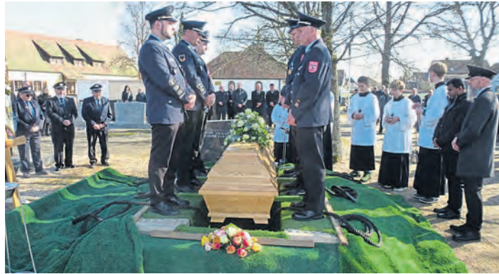
Feuerwehrmänner aus Weiherhammer und Kaltenbrunn begleiteten den Sarg zur Ruhestätte.