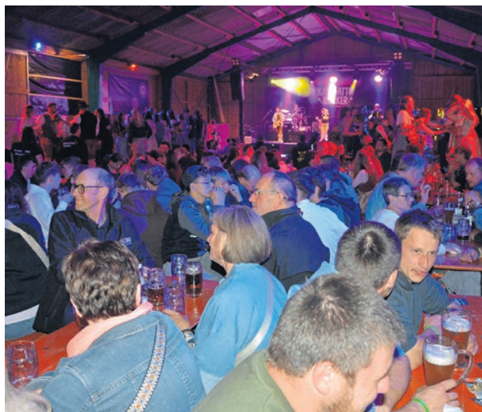
Blick in die prächtig gefüllte Festhalle. (jr)