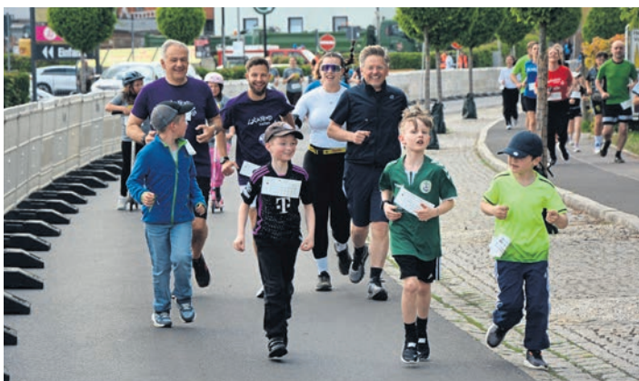
Auch die Prominenz wagte sich auf die 1,2 Kilometer lange Strecke.