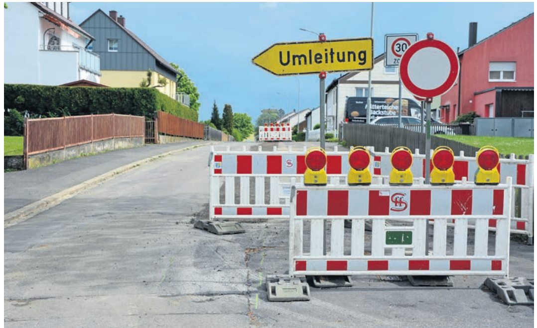
Erste Arbeiten haben auch in einem Teilabschnitt der Wiesenstraße begonnen.