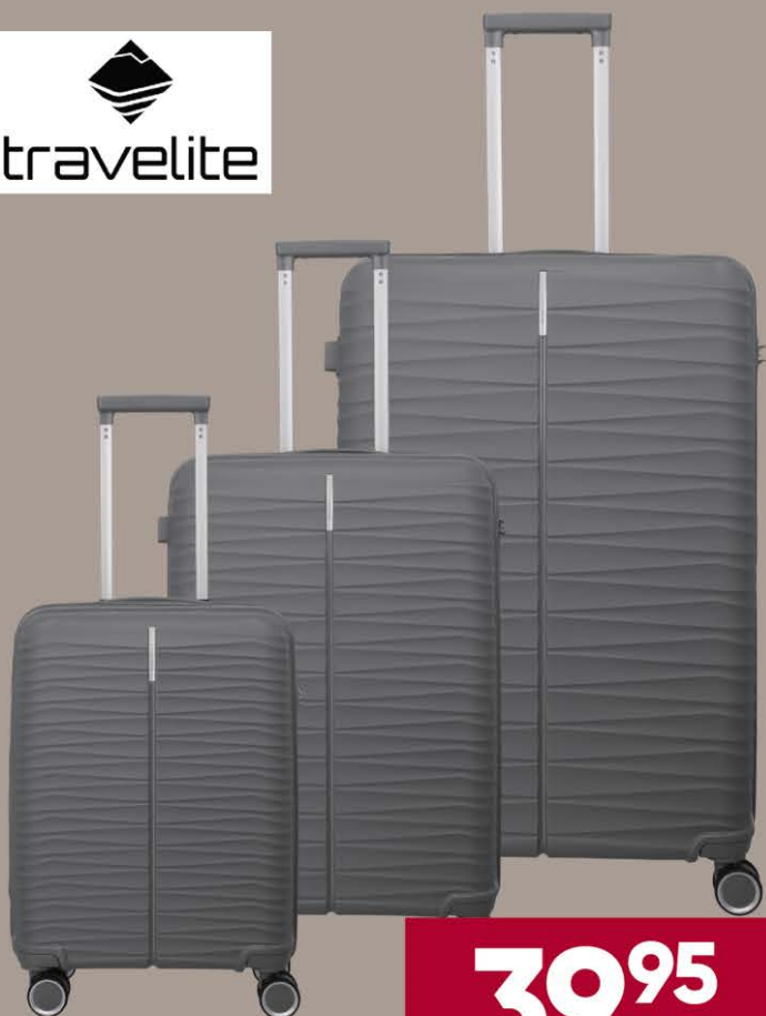
HARTSCHALEN-KOFFER, anthrazit, in 3 versch. Größen erhältlich, z.B. Größe S