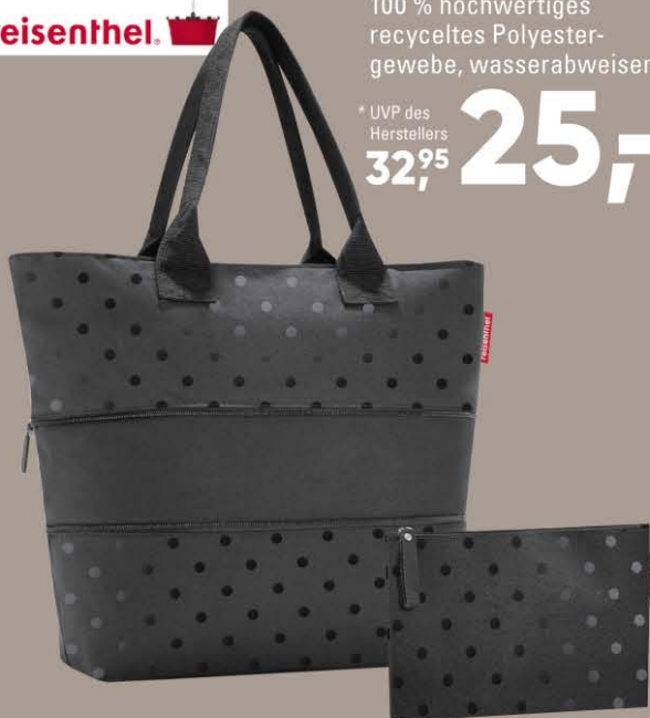
SHOPPER & CASE, 100 % hochwertiges recyceltes Polyester- gewebe, wasserabweisend