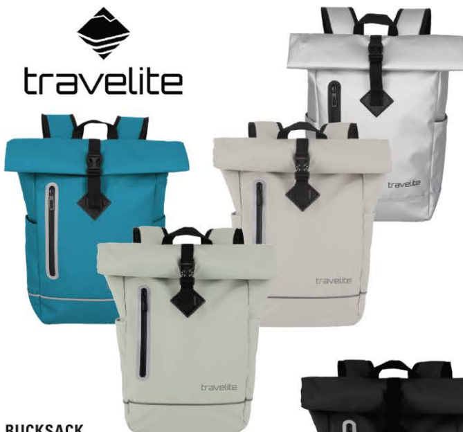
RUCKSACK, aus wasserabweisendem Material, versch. Farben, B/H/T ca. 26/48/15 cm cm.